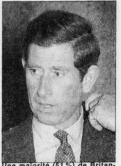
Une majorité (51%) de Britanniques estime que le prince Charles a fait plus de mal à la monarchie que n'importe quel autre membre de la famille royale, tandis que 14% désignent la princesse Diana dont il est séparé et 20% la duchesse d'York.

Une majorité se prononce pour une réduction du train de vie de la famille royale, selon la deuxième partie de l'enquête à paraître aujourd'hui.