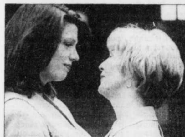
Stéphanie et sa maman ont vécu de longues et grandes inquiétudes.

Mais de Stéphanie (Macha Grenon) qui se bat contre les banquiers il n'y a plus beaucoup à tirer. Pas plus que de Michel (Roy Dupuis) qui rêve maintenant de détrôner le grand reporter sur son déclin. Il faudrait qu'il marche sur les mains pour nous étonner. C'est l'usure de la petite vie, quoi!