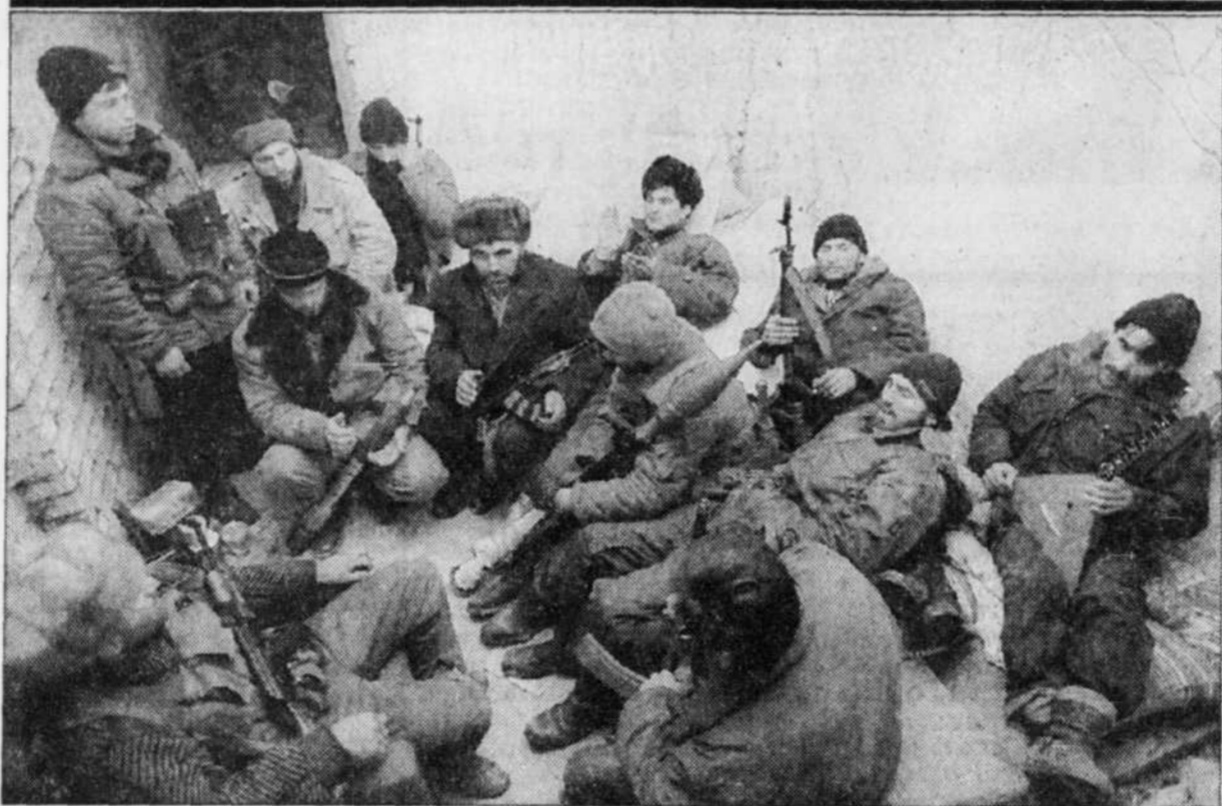
Un groupe de combattants tchétchènes font une pause dans le sous-sol d'un immeuble de Grozny pendant une attaque à la roquette de l'artillerie russe au centre de la capitale de la Tchétchénie. Les combats pour le contrôle de Grozny se poursuivent au gré d'énormes pertes de part et d'autre.