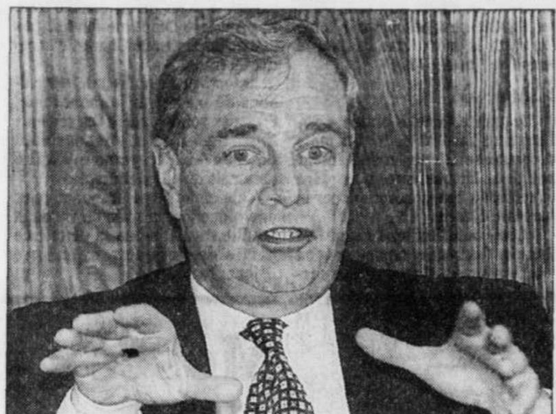
Le ministre Paul Martin

Il avait également laissé entendre que les Canadiens écoperaient encore une fois de hausse d'impôt, une mesure