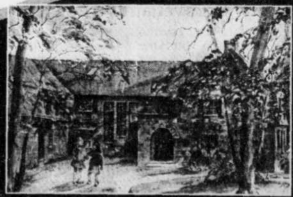
Aquarelle de S. Louise Godin

Primaire 1er cycle Pour filles pensionnaires ou externes Une école à dimension humaine dans un site enchanteur