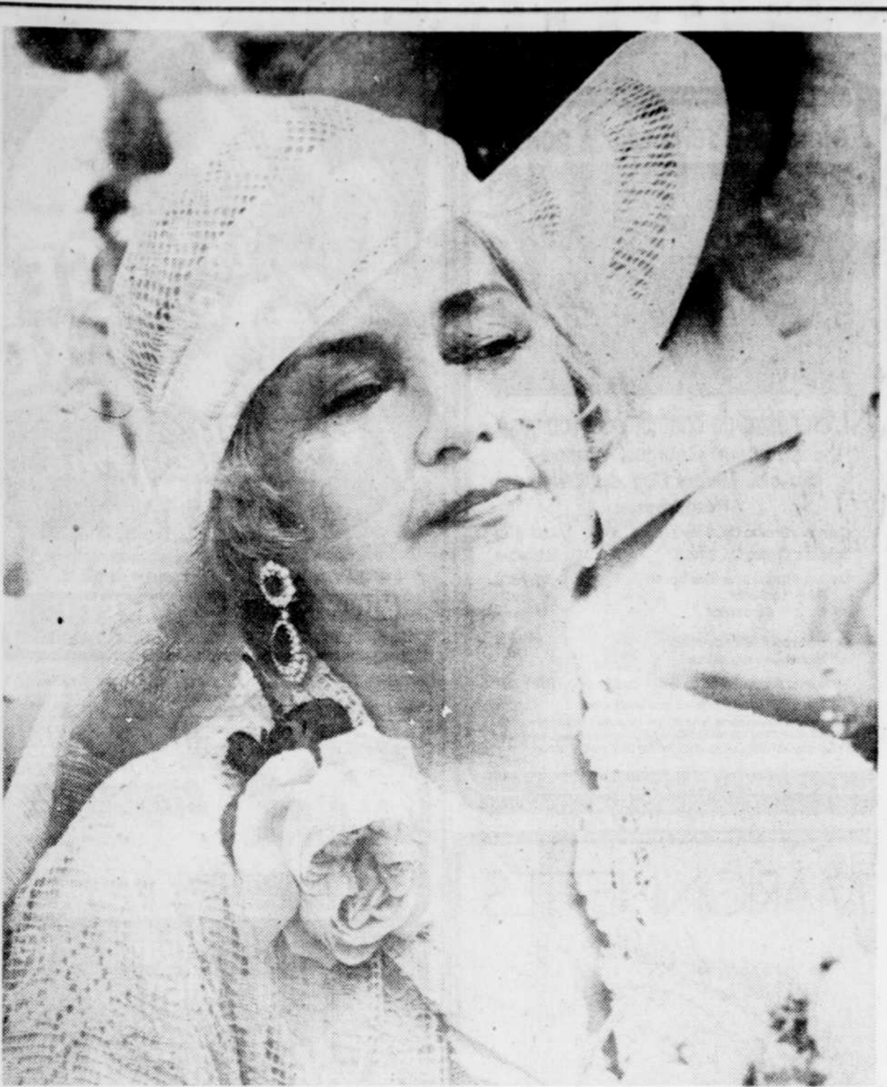
Joan Blondell est décédée

Ces jours sans amour et sans liberté ne peuvent plus jamais revenir à la scène, ni en Chine", a-t-elle affirmé.