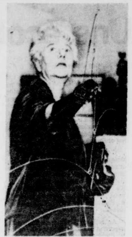
Peggy GUGGENHEIM, en 1965

En 1946, elle ferme sa galerie new-yorkaise "Art of this Century", et s'installe définitivement à Venise, au palazzo Venier dei Leoni, sur le Grand Canal, pour poursuivre sa quête insatiable d'œuvres d'art moderne. Peggy Guggenheim, a affirmé un critique, "a fait, en mieux, ce que beaucoup de musées ont essayé de faire".