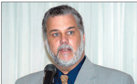
D' Philippe Couillard lors de l'allocution de clôture