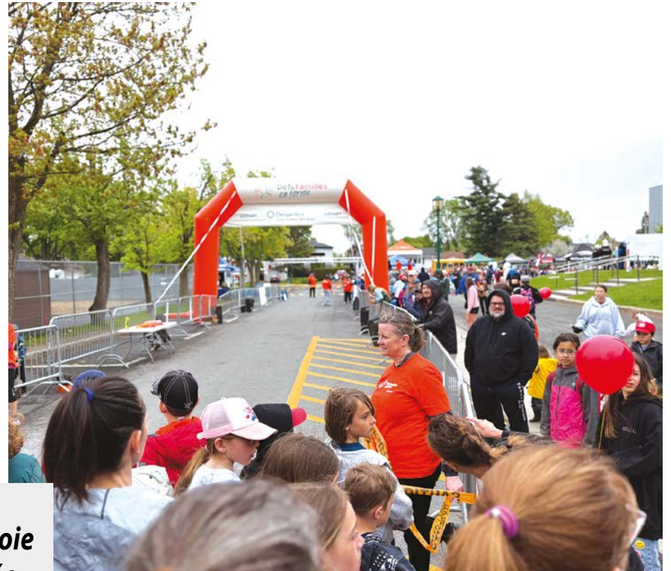
Le 18 e Défi Familles en forme de Saint-Basile-le-Grand se déroulait le 24 mai.