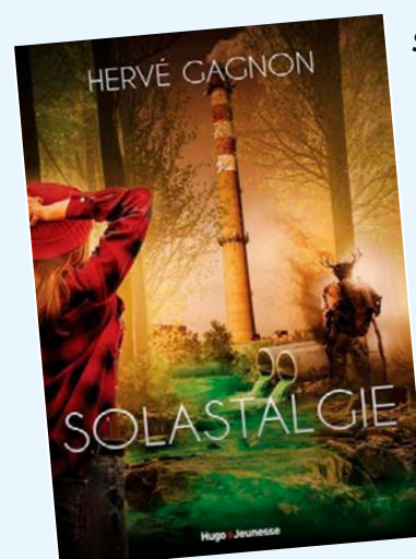
Solastalgie / Hervé Gagnon

Murielle, une petite musaraigne attachante, vit depuis toujours dans le même sous-bois, qu'elle connaît par coeur. Un matin, en pleine chasse aux escargots, elle tombe nez à nez avec un étrange « mystère » rond, noir et flou. Surprise, elle s'en détourne... mais ces mystères se multiplient et la suivent jusqu'à chez elle. Inquiète, puis curieuse, Murielle rassemble son courage et décide de les affronter. Après une période de peur et d'inconfort, elle découvre qu'elle peut s'adapter à l'inconnu.