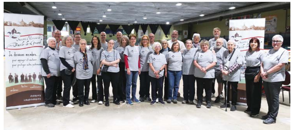
Le comité bénévole de la grande vente de livres d'occasion.

pas au contexte politique et économique ». Il raconte. « Nous avons une grande table de guides de voyage. Pratiquement tous les guides pour des destinations européennes sont partis, mais nous n'avons presque rien vendu pour les destinations américaines, même si nous avons des guides de très belle qualité. » Chaque année que cette activité est organisée (elle a été mise sur pause à l'époque de la COVID), la participation citoyenne demeure très familiale. On peut y observer autant de nouveau-nés que d'ainés.