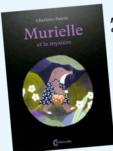
Murielle et le mystère / une histoire de Charlotte Parent

Ce matin, c'est l'émoi parmi les élèves de Mme Tzatziki. Moka, le hamster nain de la classe, s'est volatilisé! Ils ont beau fouiller tous les coins et recoins, la petite boule de poils reste introuvable! Marie décide de mener son enquête et les suspects ne manquent pas à ses yeux!