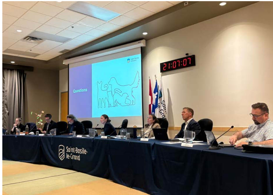
Le conseil municipal de Saint-Basile était réuni le 1 er juin en séance.

Puis, après une consultation auprès des usagers, une analyse et des recommandations, le conseil municipal prendra une décision en janvier prochain.