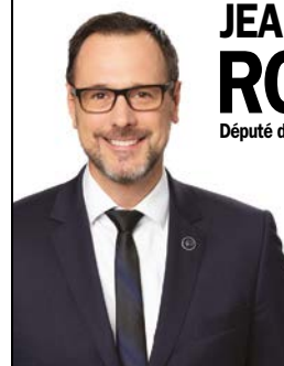
JEAN-FRANÇOIS ROBERGE Député de Chambly

L'objectif est clair, nous devons offrir les bons soins au bon moment et améliorer l'accès aux soins pour les Québécois.