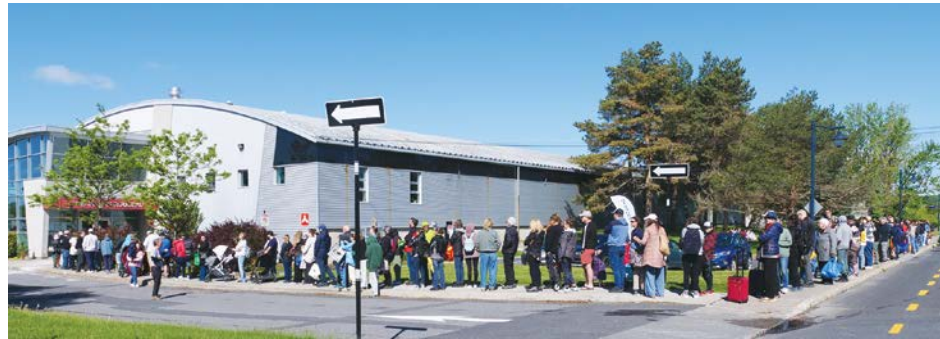
La grande vente de livres d'occasion attire plusieurs personnes, et ce, avant même l'ouverture des portes le samedi matin.

Il poursuit. « Le samedi, nous avons enregistré une moyenne de 16 livres par achat. Lundi, après la vente, 207 caisses de livres, de plus petit format qu'à la réception, ont pris le chemin vers Latulippe, au Témiscamingue, pour la mise sur pied d'une bibliothèque dans un centre communautaire. »