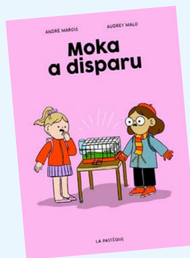
La classe de Madame Tzatziki. Moka a disparu / André Marois; illustrations d'Audrey Malo