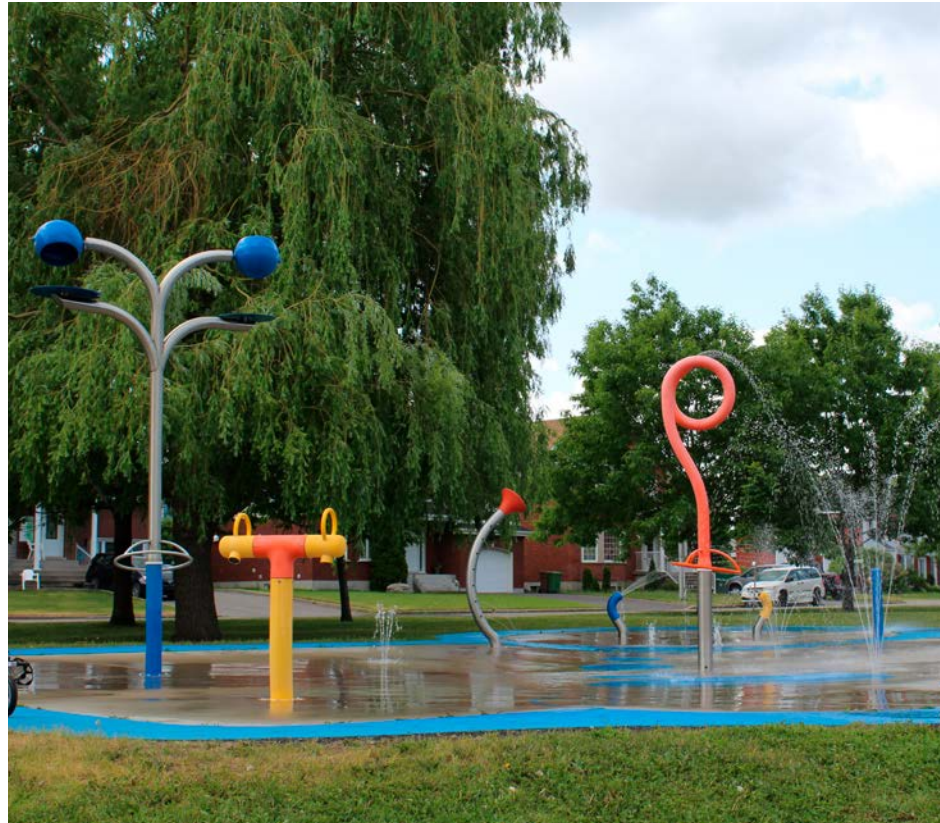
Les jeux d'eau du parc de Montpellier.

Notons que la plus basse soumission, de l'ordre de 338 176 $, s'est avérée non conforme.