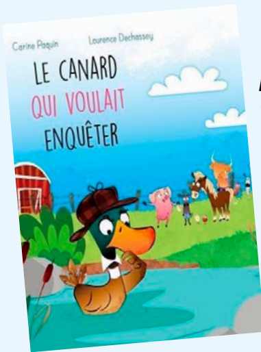
Le canard qui voulait enquêter / Carine Paquin; illustrations de Laurence Dechassey

CET ÉTÉ, LA BIBLIOTHÈQUE ROLAND-LEBLANC PROPOSE DES LECTURES MYSTÉRIEUSES POUR LES JEUNES ÂGÉS DE 1 À 17 ANS. ATTENTION, CERTAINES LECTURES SONT À VOS RISQUES ET PÉRILS! VOUS POURREZ Y FAIRE DES DÉCOUVERTES ÉTRANGES ET PARFOIS MÊME HORRIFIANTES, MAIS ASSURÉMENT DES LECTURES ENVOÛTANTES. NOUS VOUS INVITONS À NOTRE GRANDE FÊTE DE LANCEMENT, CE SAMEDI 13 JUIN, POUR EN CONNAÎTRE D'AVANTAGE SUR LE BIBLIOCLUB SOUS LE THÈME « ENQUÊTES ET MYSTÈRES ». (UNE COLLABORATION DE CHRISTINE LAROUCHE, TECHNICIENNE EN DOCUMENTATION)