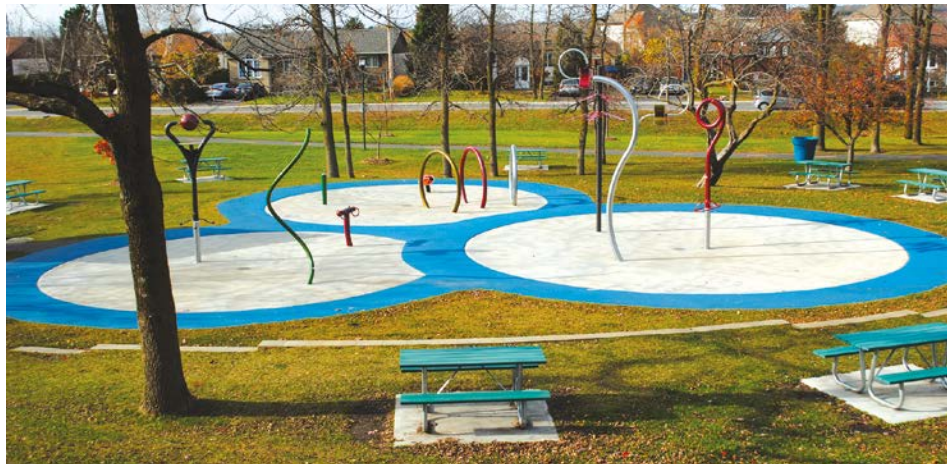
Les jeux d'eau du parc du Ruisseau.

À Saint-Basile-le-Grand, les jeux d'eau du parc du Ruisseau sont maintenant ouverts.