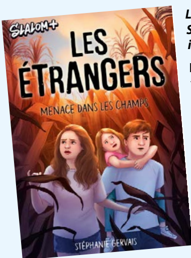
Les étrangers : menace dans les champs / Stéphanie Gervais; illustrations de Sabrina Gendron

Âgée de 8 ans, Bubba la border collie habite avec ses humains depuis qu'elle est bébé. Bien qu'elle ne puisse surveiller un troupeau de moutons comme le dicte son instinct, elle tente de chasser l'ennui de diverses façons. C'est ainsi qu'elle décide de devenir l'enquêtrice du quartier et de résoudre les petits problèmes qui surviennent dans son entourage canin.