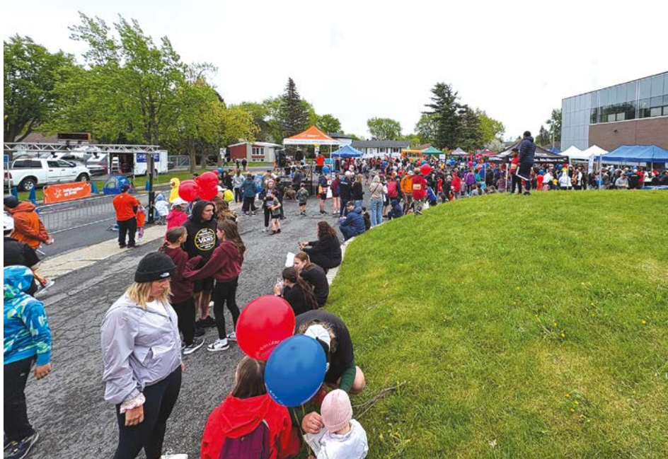
Le Défi Familles en forme a attiré plus de 900 coureurs.