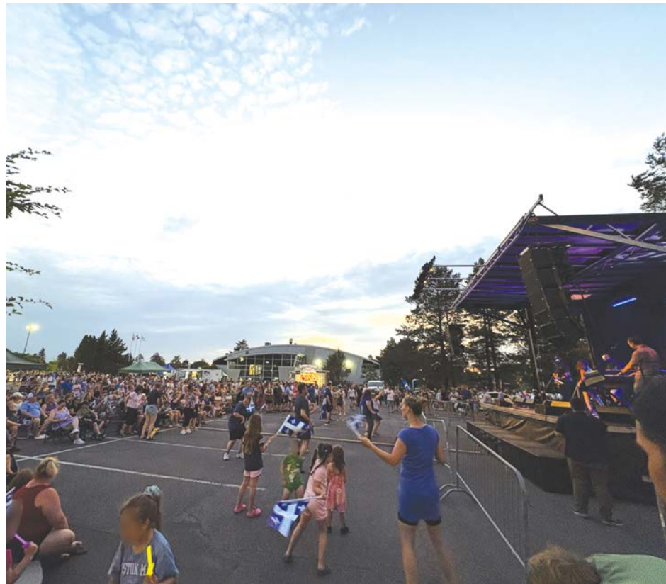
Le groupe Osmoze était en concert l'année dernière à Saint-Basile.

À Saint-Basile-le-Grand, l'ambiance sera à la fête de 14 h à 20 h le 24 juin. Les activités ont lieu au parc du Ruisseau, à proximité de l'aréna Jean-Rougeau.