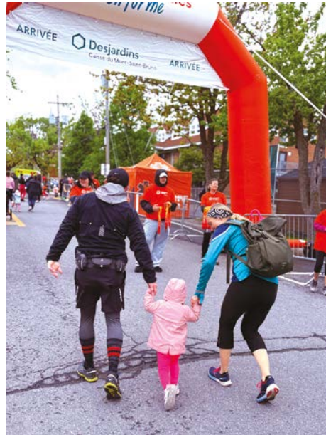
Franchir la ligne d'arrivée avec papa et maman.