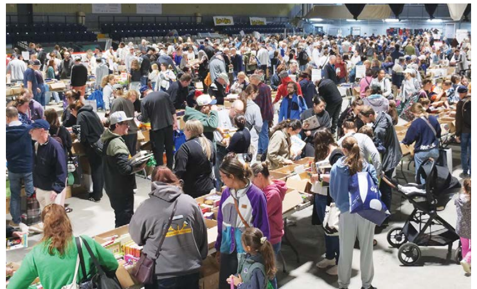
Il y avait foule à l'intérieur de l'aréna pour le traditionnel événement de la Société d'histoire.