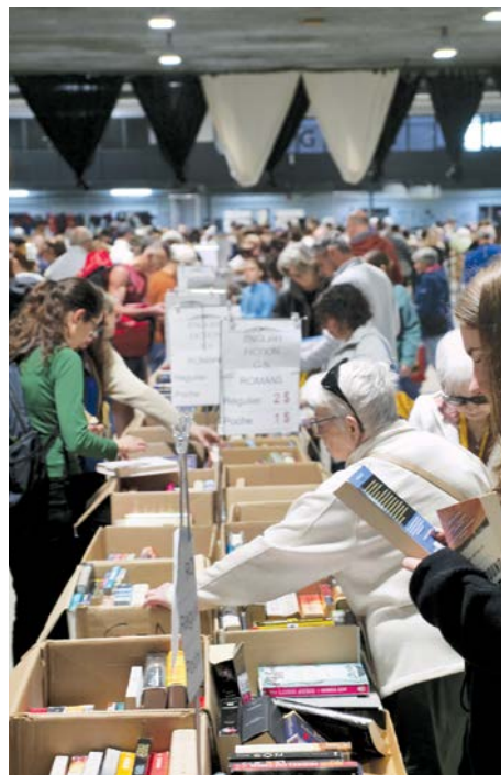
Des milliers de livres offerts à petits prix.

En tout, l'événement a mobilisé 36 bénévoles, répartis sur 7 jours complets pour la mise en place, la vente et le démontage.