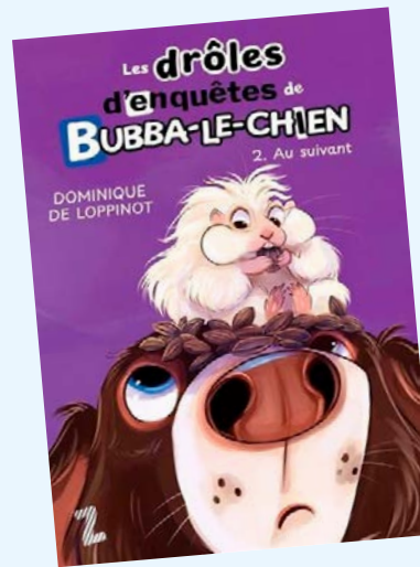
Les drôles d'enquêtes de Bubba-le-chien. Au suivant! / Dominique de Loppinot; illustrations de Juliette Miron

Les animaux de la ferme de la Haute-Cour sont alléchés par la bonne odeur s'échappant de la pâtisserie. Chacun espère avoir un petit gâteau à déguster. Mais, horreur! Un gâteau a disparu! Oscar le canard décide de mener l'enquête pour retrouver le coupable.