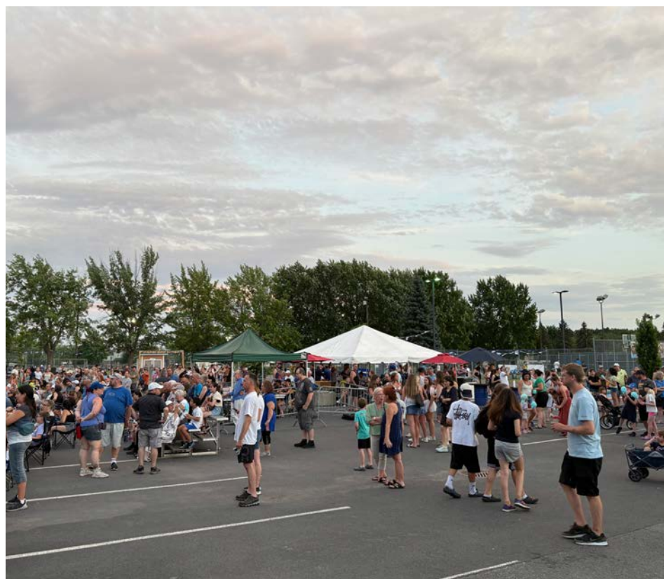
Le parc du Ruisseau peut accueillir plusieurs personnes.

Un projet de réaménagement de ce parc est aussi dans les plans. Le projet « Réparation et bonification des installations » du parc de Montpellier apparaît au plus récent Programme triennal d'immobilisations. Dans le mobilier urbain, certains éléments sont accessibles aux personnes à mobilité réduite.