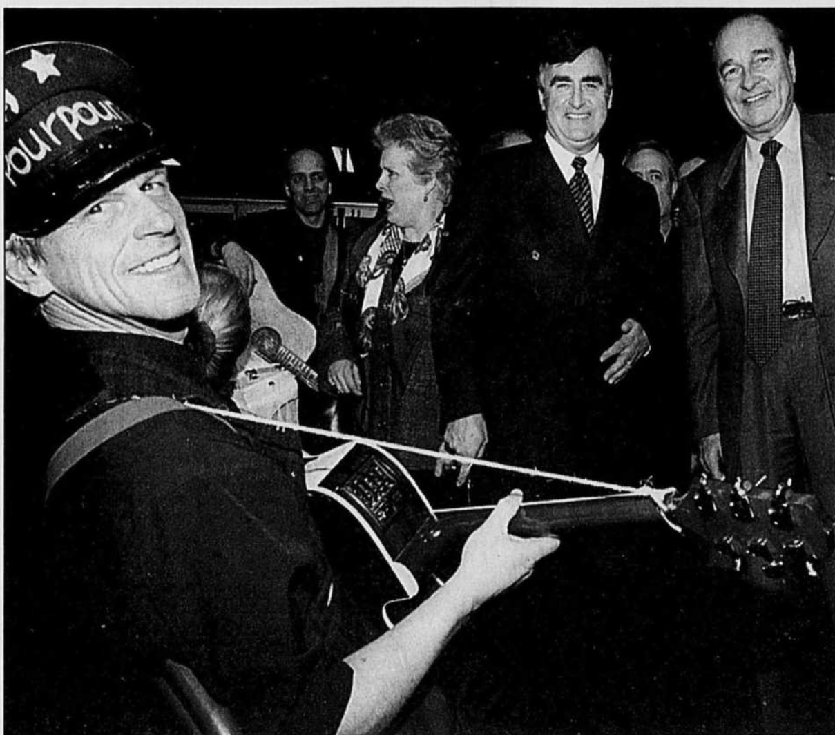
Le président français Jacques Chirac (à droite) et le premier ministre du Québec, Lucien Bouchard, se sont arrêtés le temps d'une photo et d'un air de guitare, hier, durant l'inauguration du Salon du livre de Paris.