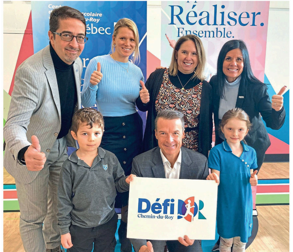
Dédié à 20 000 étudiants et 5000 membres du personnel, un tout nouveau Défi Chemin-du-Roy verra le jour en mai prochain.

Le Défi Chemin-du-Roy se conclura avec l'activité