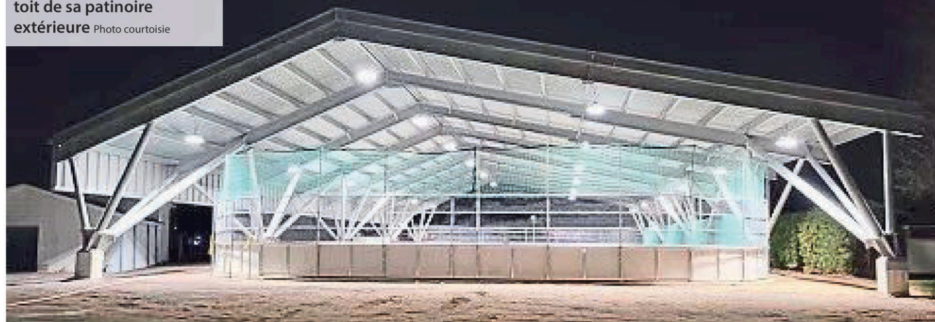
Maskinongé a inauguré le toit de sa patinoire extérieure

6 - LÉCHO DE MASKINONGÉ - www.lechodemaskinonge.com - Le 8 février 2023