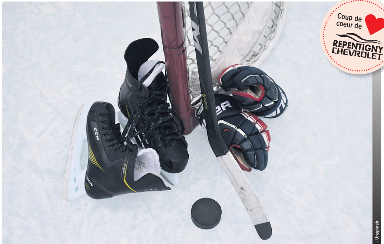
Les parents de hockeyeurs et patineurs artistiques espèrent toujours des solutions pour alléger la facture de la surprime.

Le maire a cependant répliqué en expliquant que le choix de s'arrimer sur le plafond de la contribution avait pour but d'éviter un clivage entre les jeunes des trois municipali-