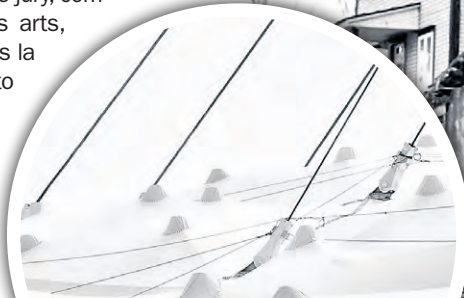
Ce gros plan du toit du Stade olympique de Montréal a mérité à son auteur l'or chez les professionnels, dans la catégorie « Architecture ».

Ce lieu significatif a par la suite été acheté par la municipalité qui y a érigé la Maison Bélisle, un musée hébergeant une exposition permanente sur l'histoire de la ville. Cette image y figure d'ailleurs. Des années après sa création, Sébastien Arbour reçoit le vote du public chez les professionnels pour cette œuvre, dans la catégorie « Film / Analog ». (MCG)