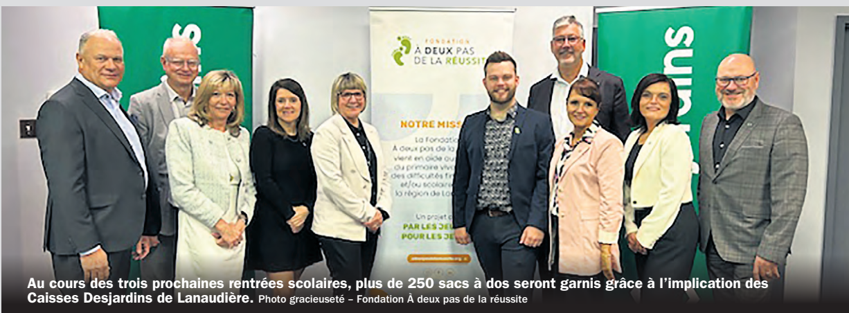
Au cours des trois prochaines rentrées scolaires, plus de 250 sacs à dos seront garnis grâce à l'implication des Caisses Desjardins de Lanaudière.