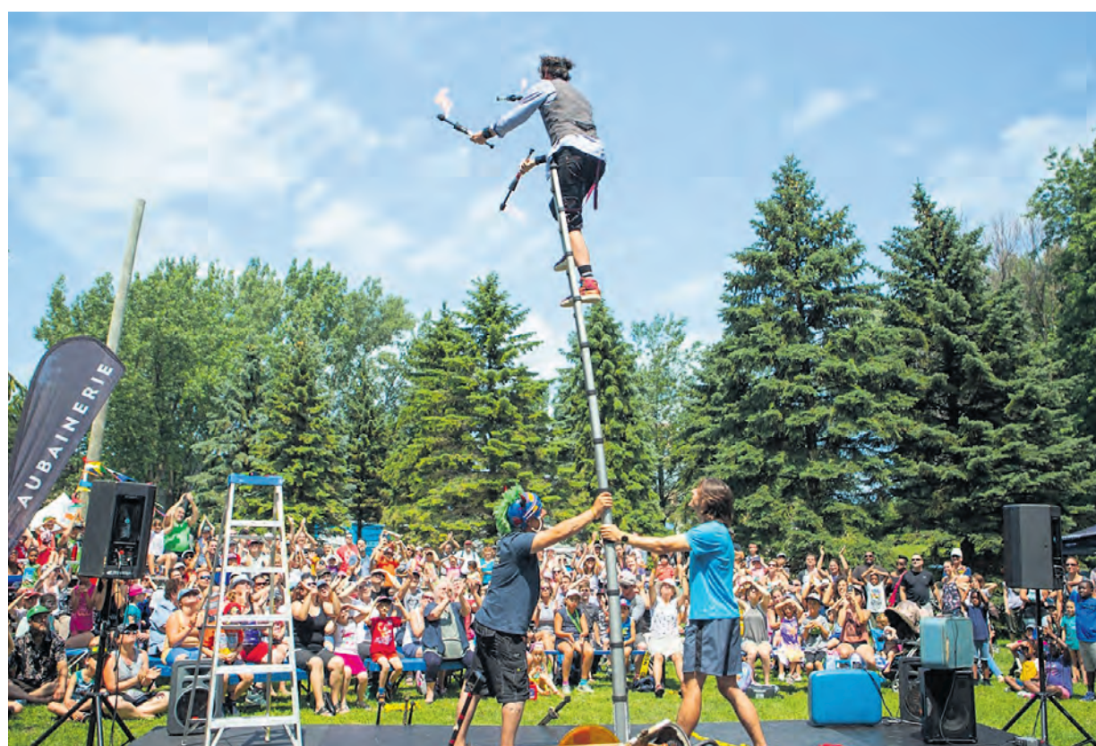
Au cours des 30 dernières années, Mon Festival a accueilli plus de 300 000 visiteurs et des centaines de spectacles professionnels adaptés au jeune public.

Pour découvrir la programmation complète: www.mon-festival.ca .