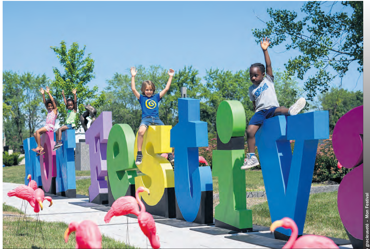
La programmation de Mon Festival est offerte gratuitement aux enfants et à leur famille.

Parmi les spectacles qui retiendront l'attention cette année, on compte notamment le grand retour de Fredo le magicien. Sachant dès l'âge de 10 ans qu'il voulait être magicien, il est l'exemple même de l'importance de croire en ses rêves, peu importe son âge. Il présentera son spectacle «L'expérience magique», où il exécutera des numéros énigmatiques et des prouesses d'illusions à couper le souffle.