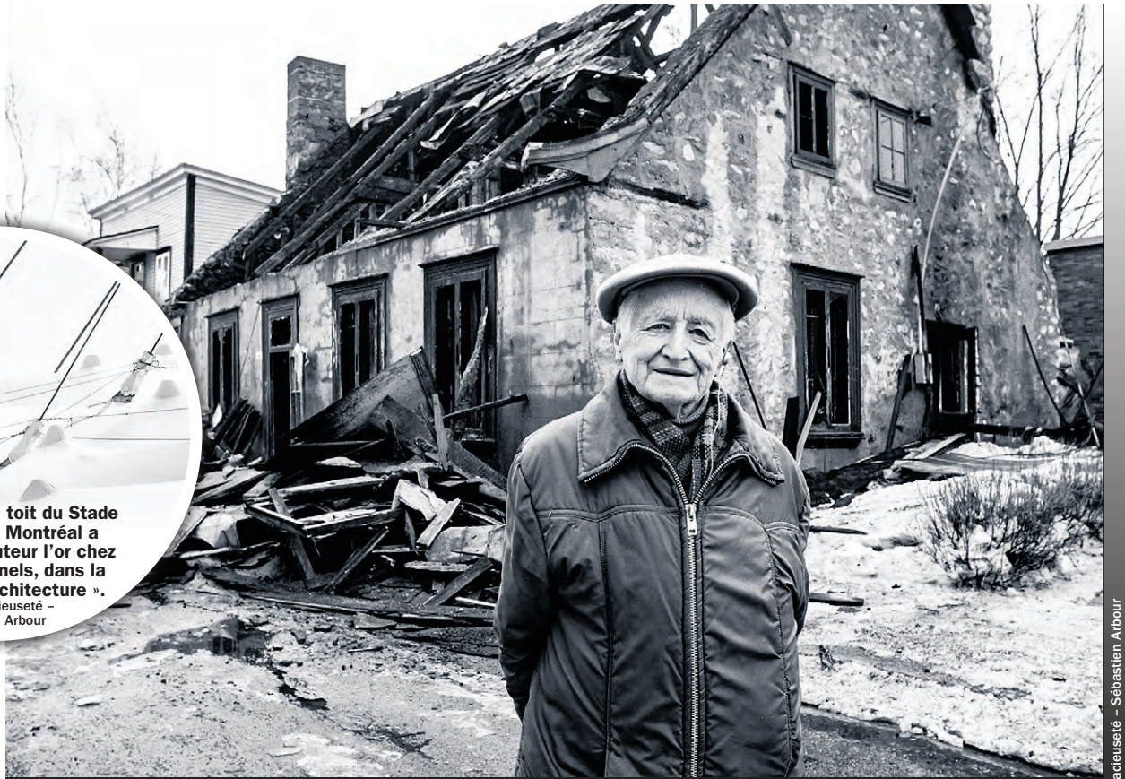
Prise il y a plusieurs années, cette image réalisée pour le journal La Revue, à Terrebonne, et montrant la Maison Bélisle incendiée dans le Vieux-Terrebonne, a remporté le vote du public chez les professionnels, dans la catégorie « Film/Analog ».