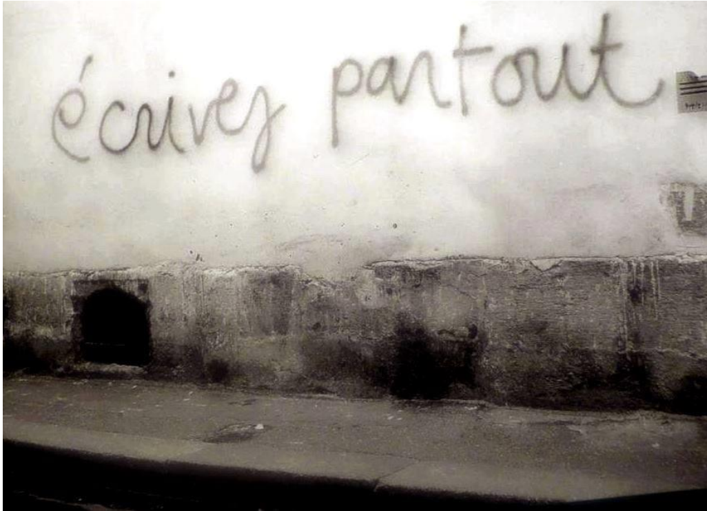
Figure 1. Tag (slogan phare) de Mai 68.

Les yeux flambent, le sang chante, les os s'élargissent, les larmes et des filets rouges ruissellent. Leur raillerie ou leur terreur dure une minute, ou des mois entiers. J'ai seul la clef de cette parade sauvage.