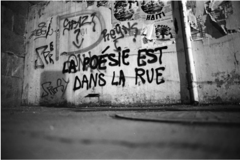
Figure 2. Graffiti d'inspiration situationniste : « La poésie est dans la rue » / Localisation: Bucarest, (à proximité du) Musée de littérature roumaine, boulevard Dacia.

(EpA, p. 101). Aussi, les graffitis peuvent être vus comme l'énigmatique couronne qui orne la communauté des Renards pâles : la souveraineté dont il est question à leur propos est poétique. Dès lors, par l'entremise des tags, on quitte l'espace figé, hiératique, des pages en prose, pour retrouver celui de la ville – où les murs ont la parole –, qui est le lieu de la poésie libre et vivace, disruptive et protéiforme : anarchique.