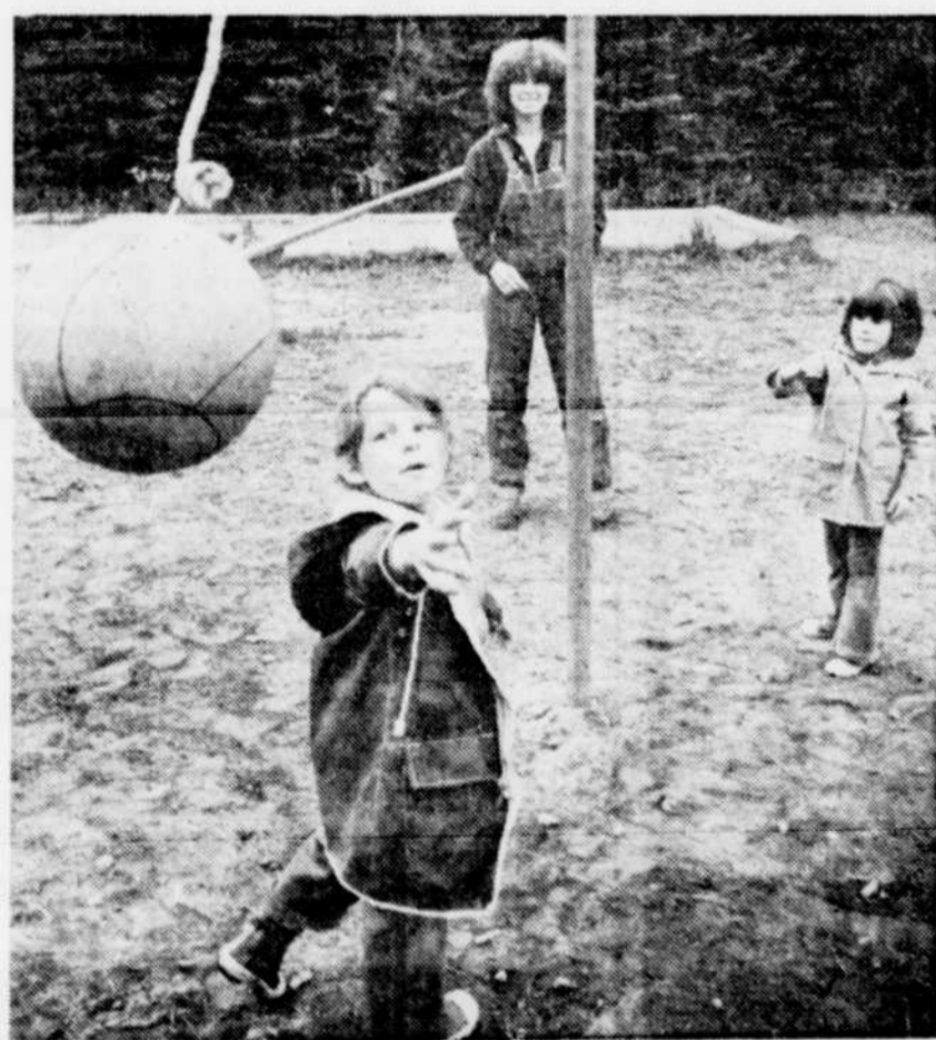
Certains camps, comme Trois-Saumons, par exemple, acceptent les participants à partir de l'âge de quatre ans.

Pour recevoir les informations sur les 6,500 camps américains (guide disponible au coût de $8US), il faut écrire à l'adresse suivante: American Camping Association, Bradford Woods, Martinsville, Indiana, 46151 USA, numéro de téléphone: (317) 342-8456.