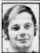
guy robillard de la Presse canadienne

LOS ANGELES — Andre Dawson a obtenu cinq coups sûrs en autant d'apparitions au bâton, égalant deux records d'équipe, et les