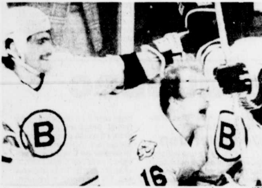
Ça rit plus fort chez les Bruins que chez les Nordiques!

En effet, il célébrait hier, tout comme Carter, son anniversaire de naissance.