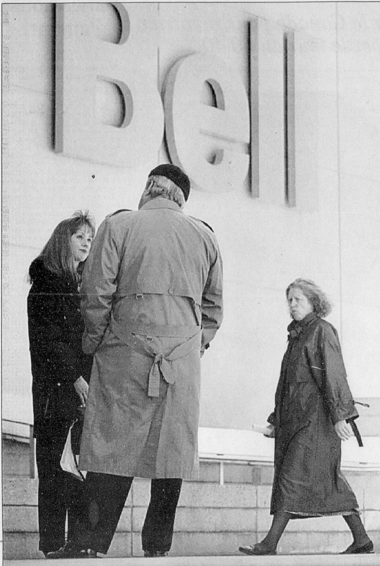
Discussion de bureau devant l'édifice de Bell, à Montréal.