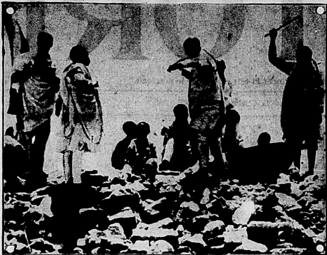
L'appel aux armes équivalant à notre mobilisation, frappé sur un tambour (ancien genre) au sommet d'une colline en Ethiopie. Plus d'un million d'hommes répondront à cet appel.