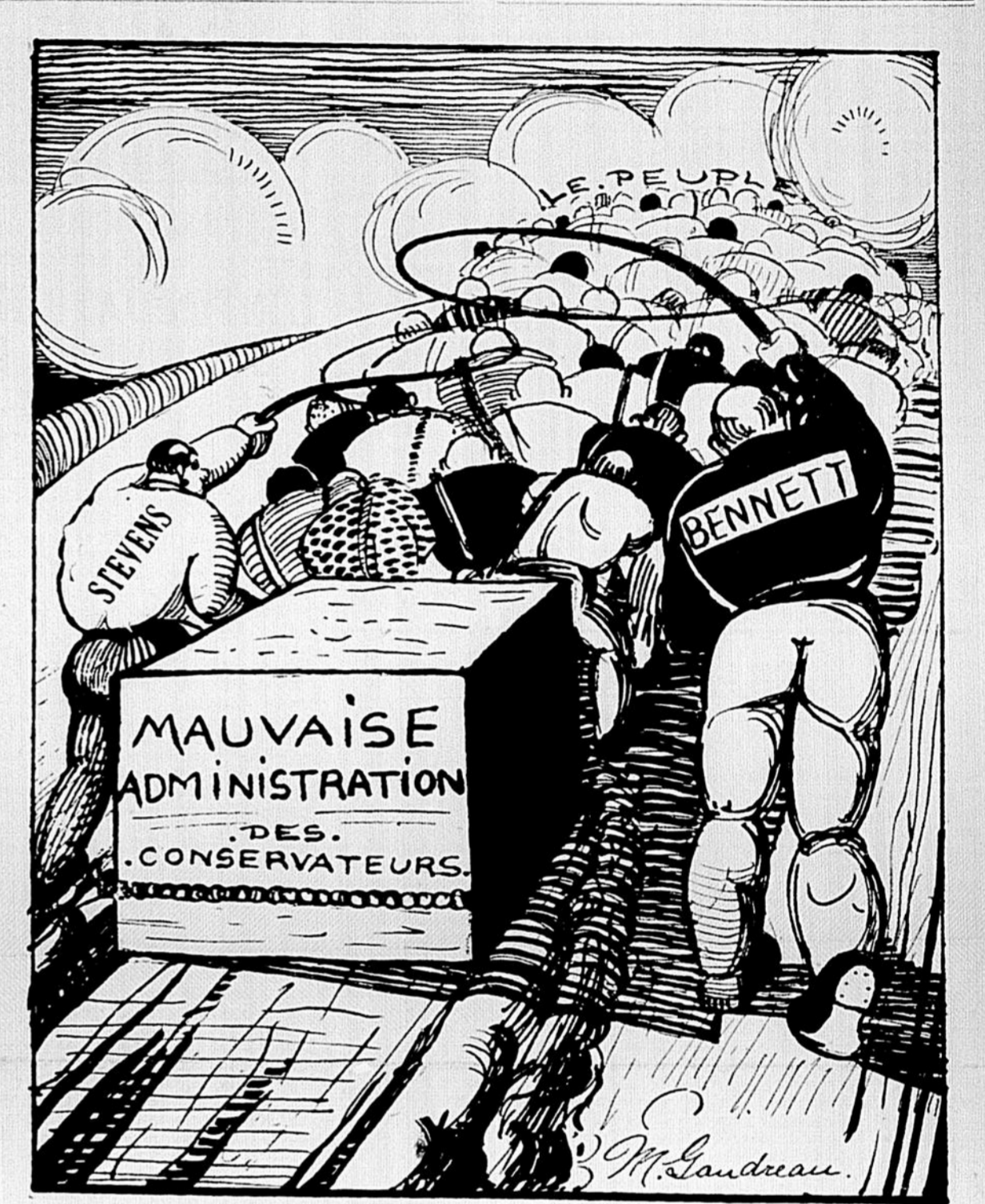
Richard Bluffing Bennett. — S'ils sont assez bêtes pour manger mes nouvelles promesses, comme ils ont mangé les anciennes, ils sont bons pour manger du foin!