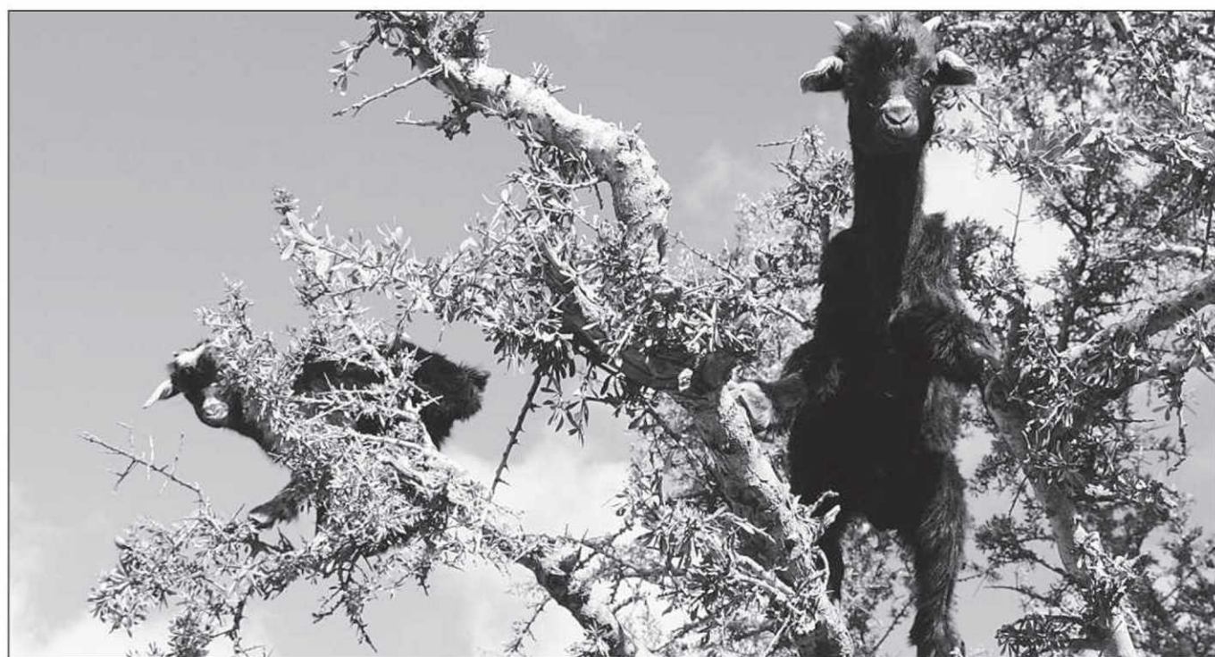
Les chèvres sont utiles à la récolte : elles grimpent aux arganiers pour se nourrir et font tomber les fruits.