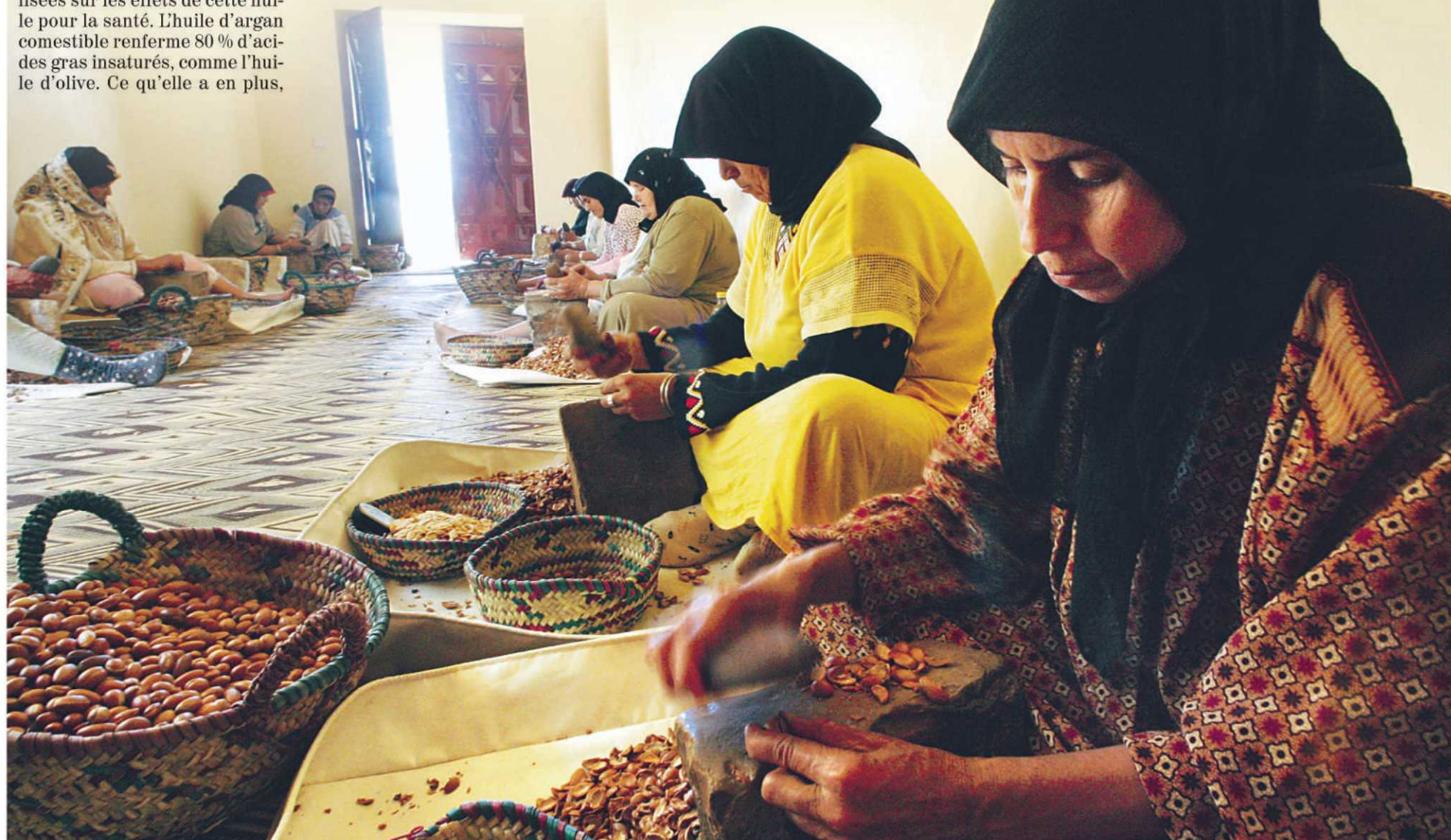
C'est en observant les belles mains des femmes qui travaillaient manuellement l'argan qu'un pharmacien s'est intéressé à cette huile pour les soins de la peau