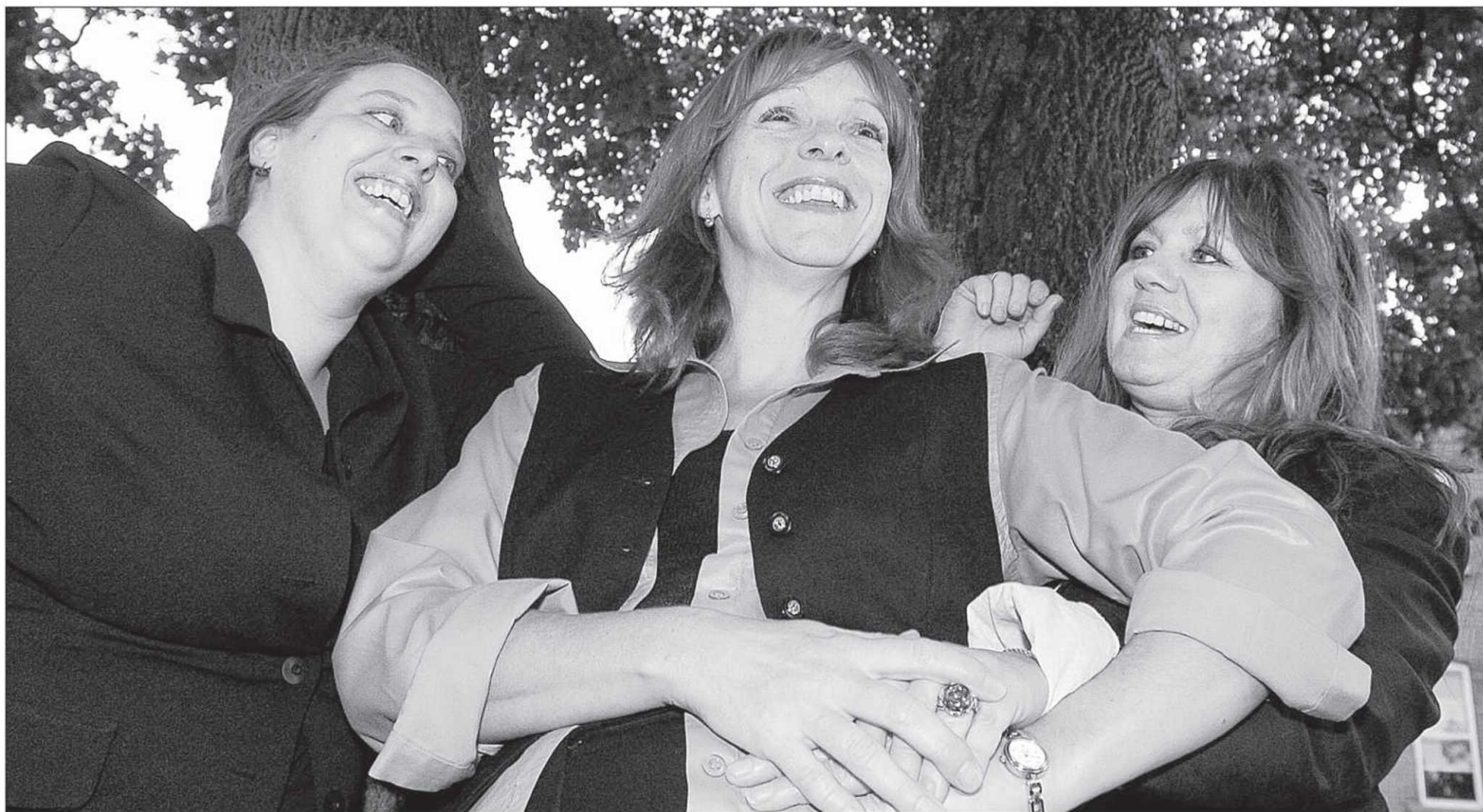
Les animatrices de la compagnie Ciel et Terre voient en elle un incubateur de créations.