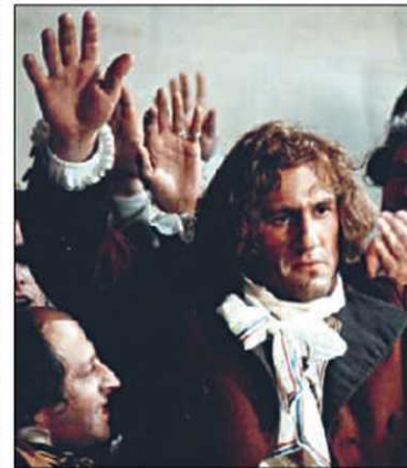
Gérard Depardieu en Danton

Histoire de la rivalité politique entre Danton et Robespierre lors