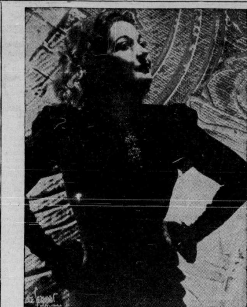
Maria Egger, soprano honraire, vedette de plusieurs films à succès, dont "La Symphonie Inachevée", "La Bohème", et qui viendra donner un récital avec son époux, le ténor polonais, Jan Kiepura, le 25 avril au His Majesty's.