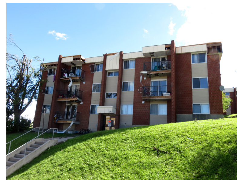
73, rue Jumonville