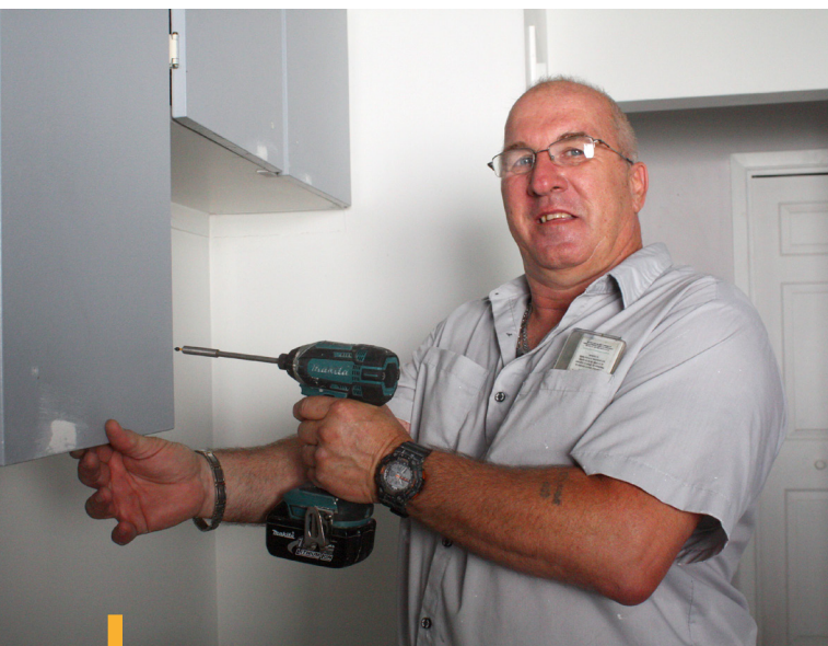
Les préposés à l'entretien effectuent différentes interventions en réparation et entretien.

En 2018, l'Office a mis en place une nouvelle technologie afin de faciliter aux locataires le transfert de demande de réparation. En effet, il a créé un formulaire disponible directement sur le site Web de l'organisme. Une façon simple et rapide pour informer d'un problème non urgent.