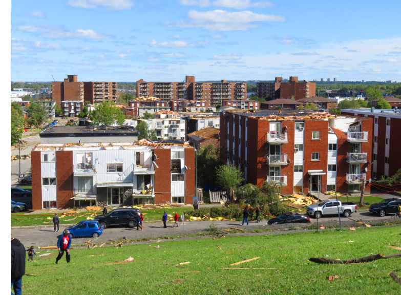
Secteur Mont-Bleu le lendemain de l'événement

1 003 MÉNAGES étaient en attente d'un logement subventionné auprès de l'Office en décembre 2018.