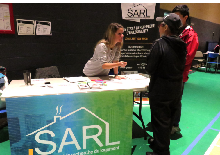
Les intervenantes du SARL au centre de services aux sinistrés

De plus, le Service d'aide à la recherche de logement (SARL) de l'Office se mobilise afin de procéder au jumelage entre les besoins de tous les sinistrés et l'offre des propriétaires. En effet, dès le lendemain du passage de la tornade, les intervenantes sont présentes au centre de services aux sinistrés afin d'informer et cibler les besoins des gens touchés par cet événement tragique.