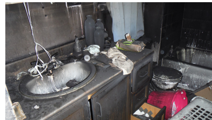
La salle de bain avant

De plus, les appartements sont beaucoup plus insonorisés grâce à une laine spéciale installée dans tous les murs. Des modifications apportées dans l'espace de la laveuse-sécheuse font aussi partie des innovations. Aménagée comme une douche avec un drain, cette solution permet d'éviter des dégâts d'eau.