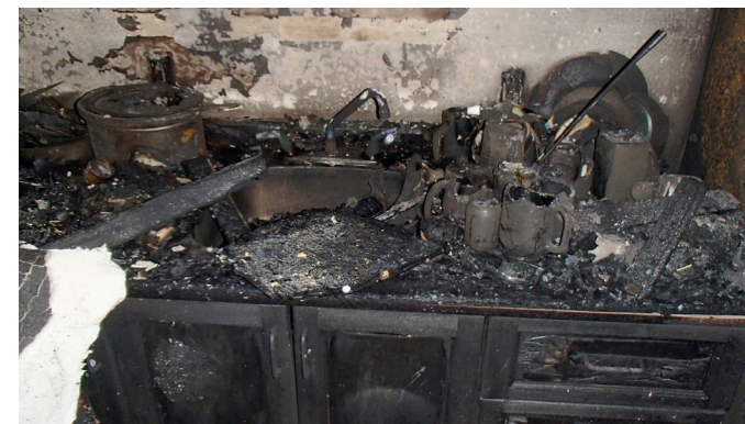
La cuisine avant

L'installation des séparations coupe-feu a pour but de ralentir le feu et donner un minimum de 30 minutes supplémentaires avant que l'incendie ne se propage dans un autre appartement. Ces travaux inaperçus assurent donc la sécurité des locataires.