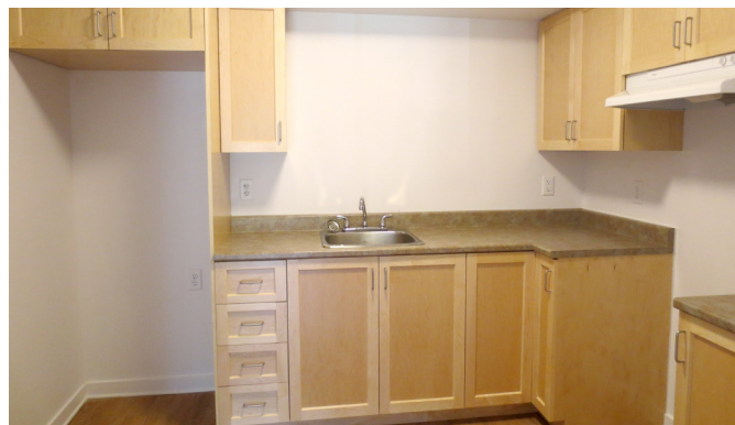
La cuisine après

De plus, les appartements sont beaucoup plus insonorisés grâce à une laine spéciale installée dans tous les murs. Des modifications apportées dans l'espace de la laveuse-sécheuse font aussi partie des innovations. Aménagée comme une douche avec un drain, cette solution permet d'éviter des dégâts d'eau.