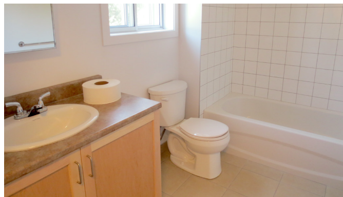
La salle de bain après

Enfin, des matériaux durables ont été utilisés dans la remise à neuf des logements. Non seulement les armoires de cuisine sont faites en bois massif, mais les garde-corps sur les balcons ont également été remplacés. En plus d'être solides, ces modifications apportent un style moderne.