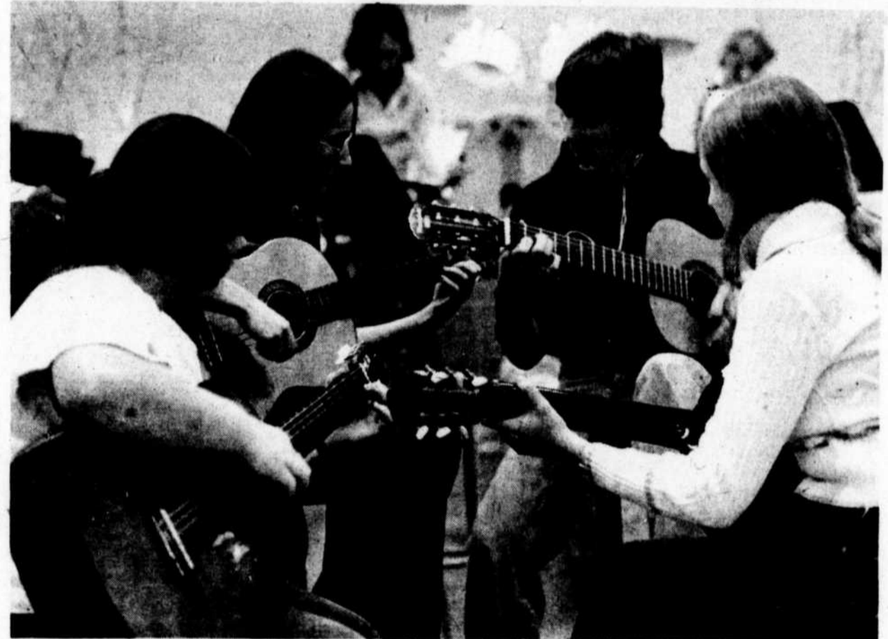
Les Décibels en spectacle

BILLET EN VENTE: Caisse Populaire de Buckingham