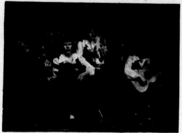
Les Décibels en pratique.