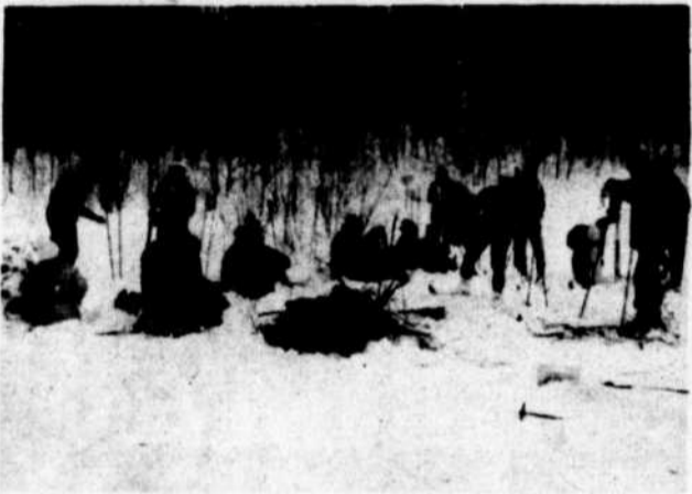
Quoi de mieux qu'une halte autour d'un bon feu et un lunch en forêt après une randonnée de ski de fond?