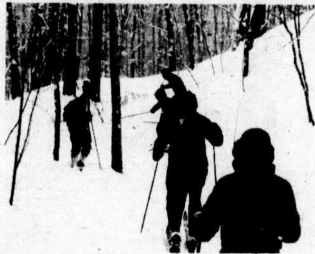
Quelques efforts qui en valent la peine.