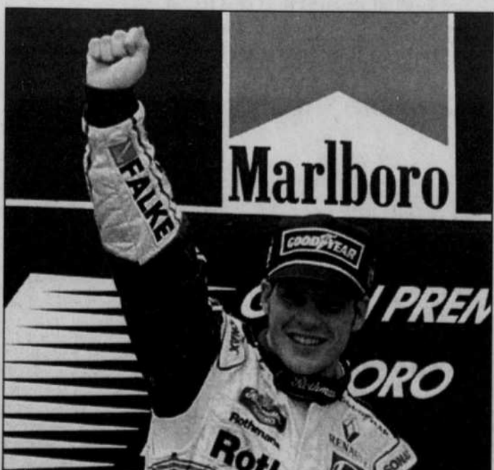
Jacques Villeneuve, qui conduisait alors une Williams-Renault, n'a pas connu depuis la joie de la victoire.

«J'ai toujours pensé que Jacques ne devait pas quitter ce sport et ce serait fantastique qu'il fasse un retour. Il a toujours été très excitant à regarder et si une écurie lui fournissait une voiture compétitive, il pourrait montrer qu'il n'a rien perdu de son adresse.»