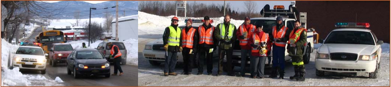
Barrage routier à Gaspé le 5 février 2008