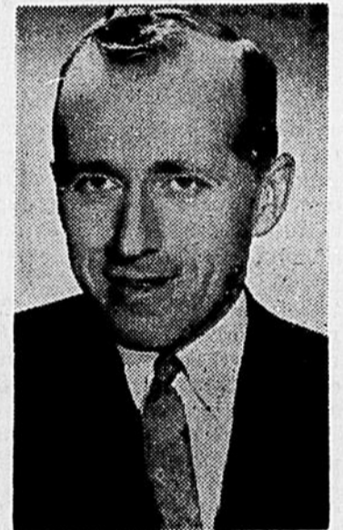
NOMINATION A LA BRASSERIE DOW R. LEMYRE

développement d'une pédagogie moins livresque plus rattachée à l'observation, à l'expérience sociale et à la culture de masse; besoin urgent de préparer un personnel enseignant très compétent.