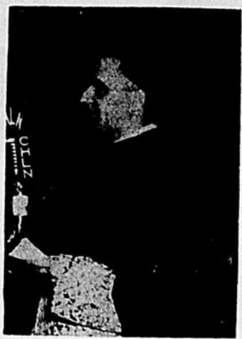
S. E. Mgr Maurice Roy, Primate de l'Eglise Canadienne

Toutefois, cette simple ébauche d'une solution ne peut suffire; après cette entrée en matière que la prudence exige, il faut couronner notre oeuvre en proclamant la bonne nouvelle de l'Évangile, conduisant nos auditeurs comme par la main jusqu'aux vérités que