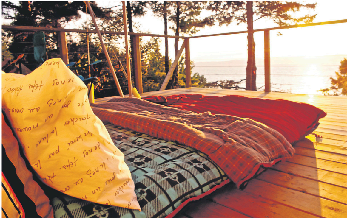
Près du village de Saint-Jean-Port-Joli, la tente Bruce (de type prospecteur) se prolonge d'une belle terrasse en bois avec vue sur le fleuve.