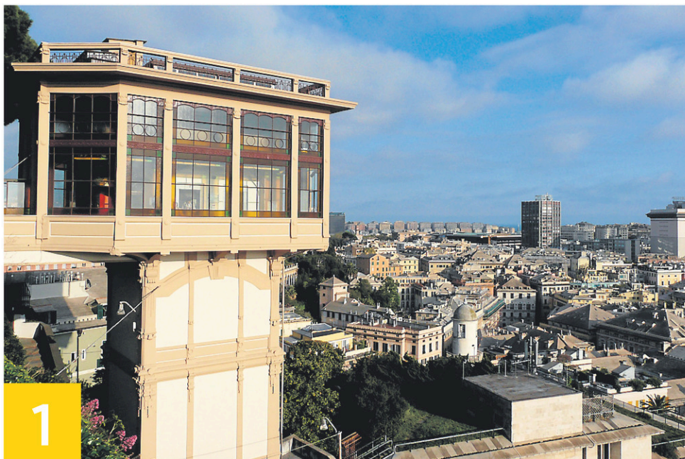
1 L'ascenseur Castelletto