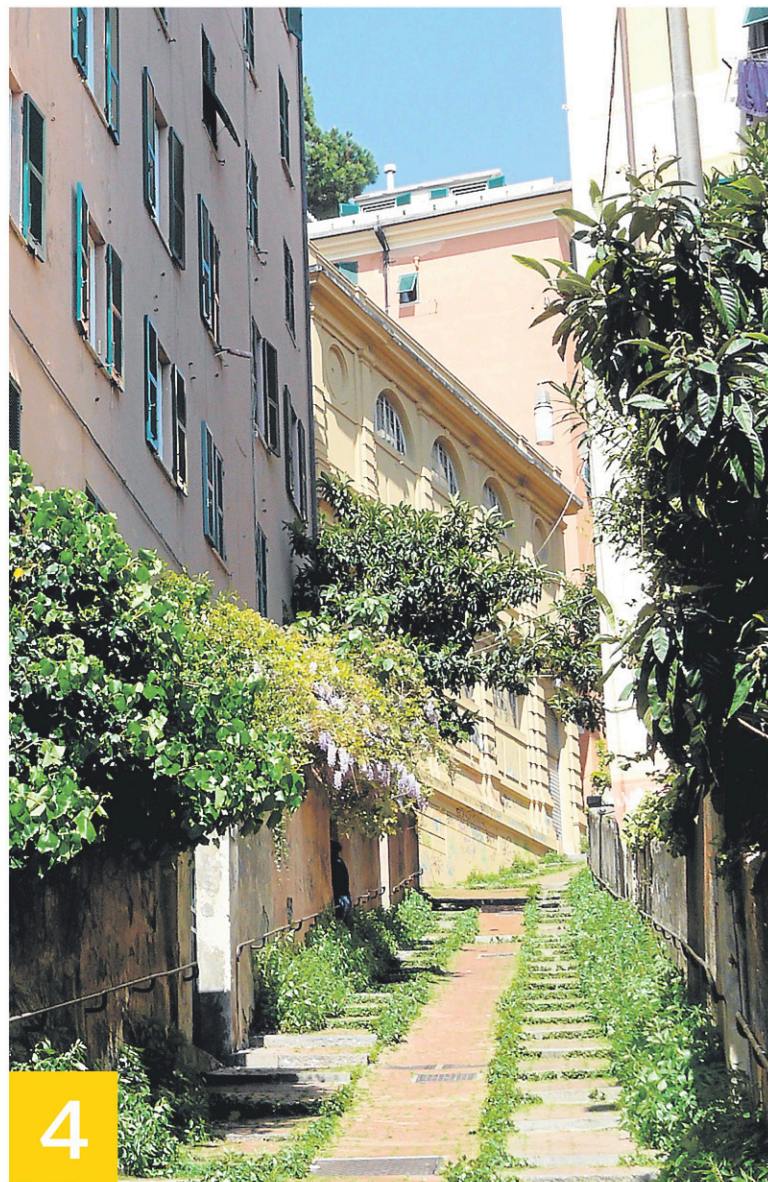
4 Une creuze

du Porto Antico vers l'est, au bout de la promenade de Corso Italia, le bourg de Boccadasse est accessible en 45 minutes de marche. Sa petite plage de galets aux bateaux de pêche est envahie de Génois et de touristes dès les beaux jours. Le train qui part du centre-ville mène à Nervi, petite ville balnéaire coquette avec ses somptueuses villas et ses boutiques de créateurs de mode. Là, une longue promenade longe le bord de mer, bordant d'un côté des piscines naturelles dans les rochers, de l'autre quelques bars et un parc luxuriant. Au-delà du cap de Santa Chiara apparaissent Vernazzola et Porto Fino avec leurs demeures du XVIII e siècle tombant à pic sur la mer.