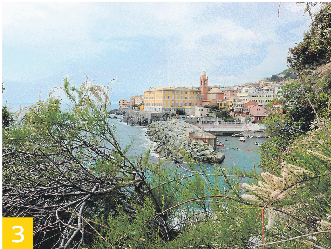
3 Vue de la promenade Garibaldi — PHOTO BÉATRICE LEPROUX COLLABORATION SPÉCIALE.

Il y flotte de délicieux parfums de glycine et de lessive. Des lézards verts courent le long des hauts murs d'où débordent citronniers et bougainvilliers. Au hasard d'un portail entrouvert, on découvre de vastes jardins fleuris. Le haut de la colline découvre les tours d'un castelletto, le port et la mer.