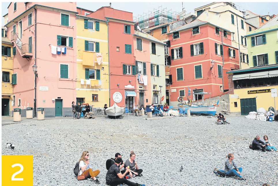
2 La plage de Boccadasse