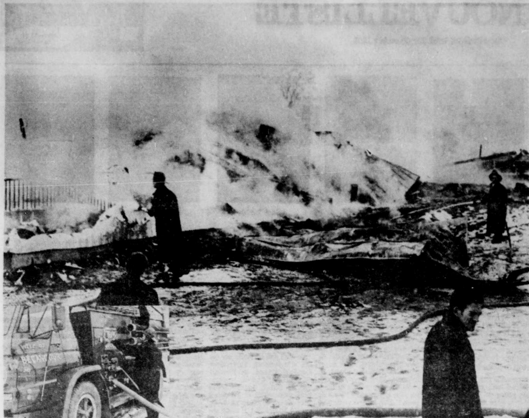
UN VIOLENT INCENDIE a fait rage durant plusieurs heures, dimanche matin, pour réduire en cendres une grande-étable située sur la route 3, entre St-Grégoire et Nicolet. Cinq pompiers de St-Grégoire ont répondu à l'appel. Plusieurs pièces d'équipement aratoire ainsi que plusieurs centaines de balles de foin et de paille ont été brûlées. Sur la