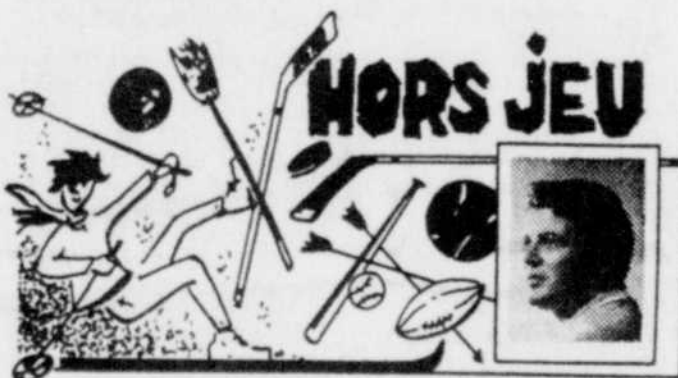
par Michel ROCHON

Une enquête est par ailleurs ouverte pour connaître si avant des vols n'auraient pas été commis à l'usine présentement en grève et ce depuis un certain temps. Après l'inventaire les policiers seront en mesure de compléter leurs investigations et pourront poursuivre leur enquête. Dans le moment ils sont sur une bonne piste qui les conduira aux deux autres individus qui étaient dans l'usine avec celui qui a été arrêté.