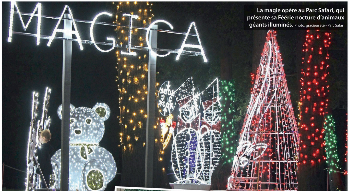
La magie opère au Parc Safari, qui présente sa Féerie nocturne d'animaux géants illuminés.