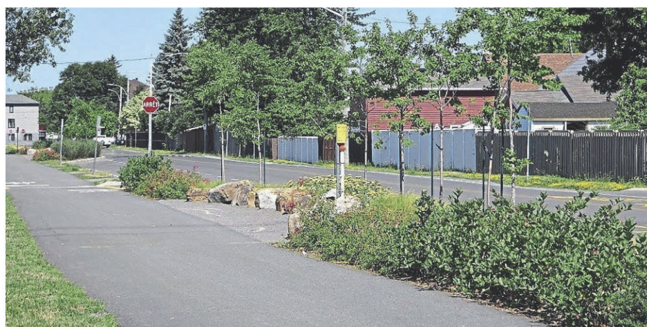
La piste cyclable longeant les écoles et le centre communautaire, à Saint-Rémi, a été joliment verdie.

De leur côté, Saint-Michel et Saint-Rémi ont reçu quatre Fleurons, ce qui signifie « Excellent ». Il s'agit donc d'un embellissement horticole remarquable dans la majorité des domaines.