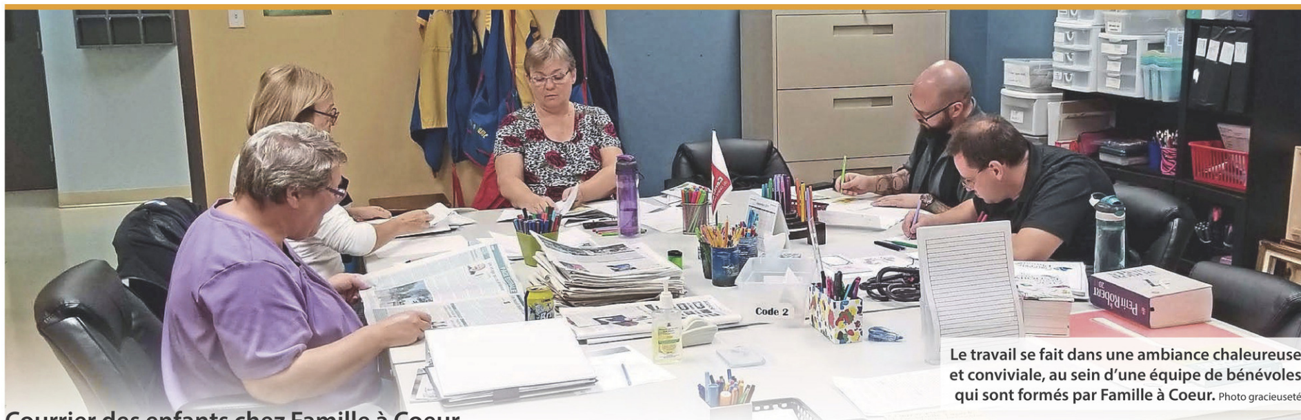
Le travail se fait dans une ambiance chaleureuse et conviviale, au sein d'une équipe de bénévoles qui sont formés par Famille à Coeur.