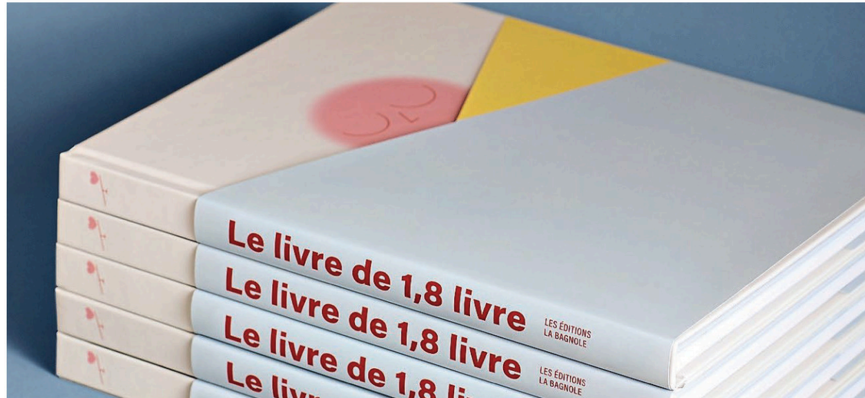
Depuis sa fondation, en 2003, l'organisme Préma-Québec a aidé plus de 40 000 familles.

On peut se le procurer chez Archambault et chez Renaud-Bray, entre autres.