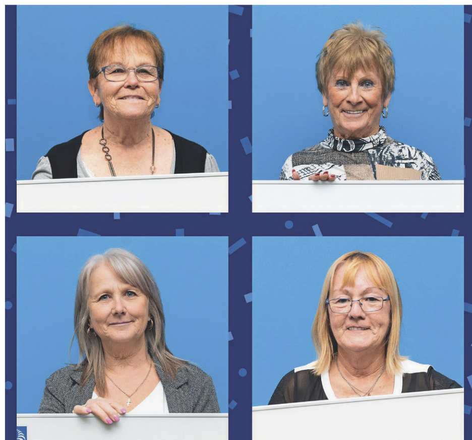
Des placements et l'achat d'une nouvelle voiture sont à l'ordre du jour pour ces heureuses gagnantes.