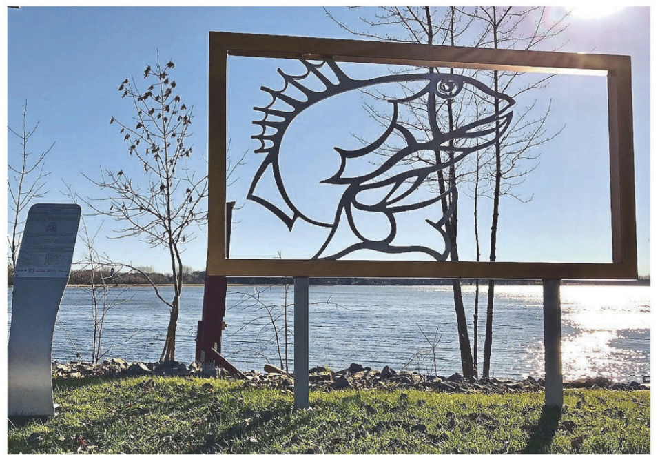
Le poisson peut être admiré à la Marina Rose des Vents, à Lacolle.

Parmi les dix nouvelles œuvres, on compte Le papillon monarque, situé au Parc Au fil de l'eau, à Saint-Blaise-sur-Richelieu, La marmotte,