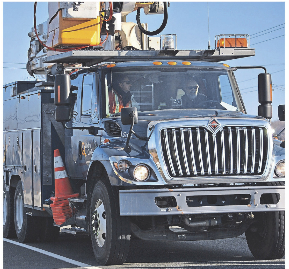
Le projet d'Hydro-Québec de ligne d'interconnexion Hertel-New York traversera les MRC du Roussillon, des Jardins-de-Napierville et du Haut-Richelieu.

Enfin, les personnes qui ne peuvent pas être présentes lors des consultations peuvent quand même transmettre leurs questions à la commission jusqu'au 7 décembre, remplissant un formulaire qui se trouve sur le site Internet du BAPE.