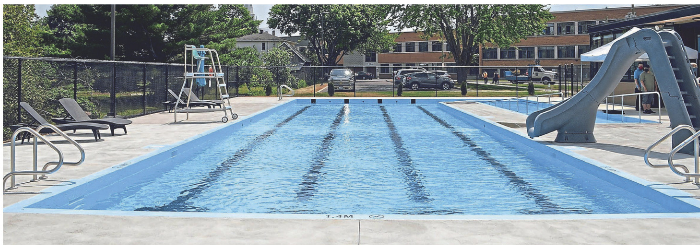
La piscine de l'Espace aquatique Jacques Délisle, à Napierville.

« La pandémie de la COVID-19 a eu de sérieuses répercussions dans le milieu aquatique. En plus d'avoir arrêté abruptement les activités dans nos piscines, comme les longueurs, baignades libres et cours aux enfants, nous avons dû mettre sur pause pour une longue période tous les cours de formation. Nous n'avons donc pas pu former