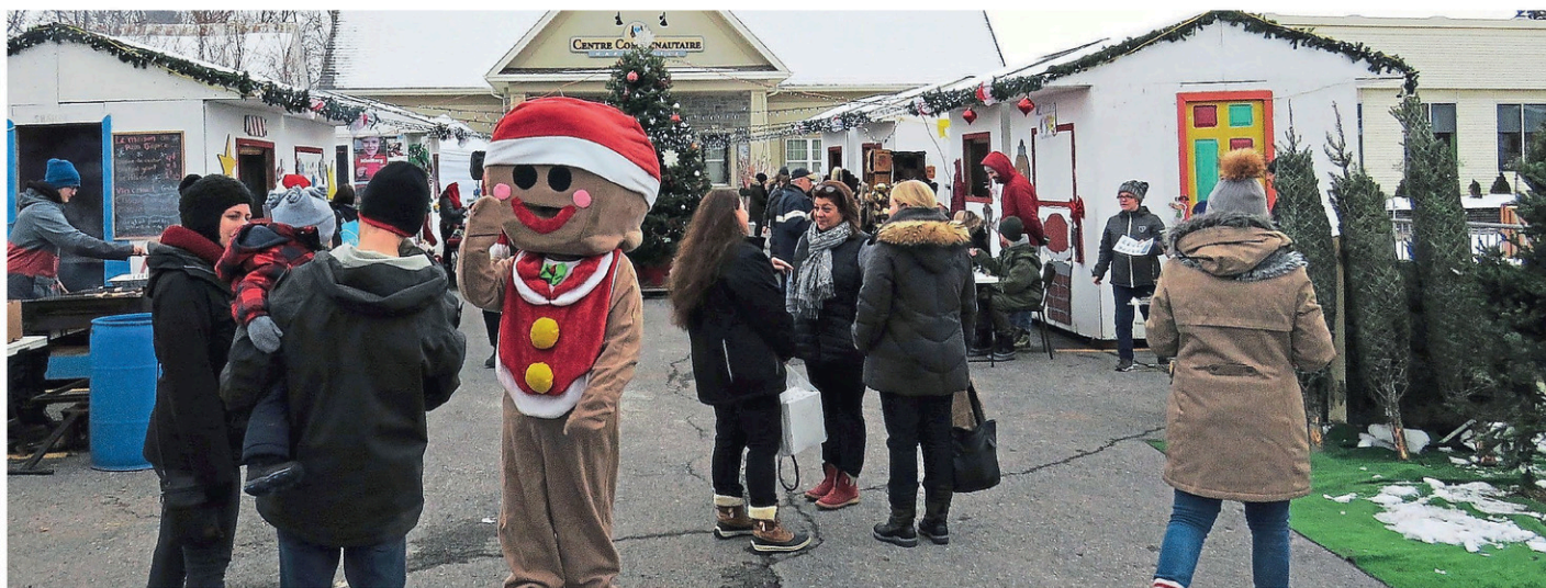
Plus de 2500 visiteurs sont attendus au Marché de Noël de Napierville et Saint-Cyprien, les 3 et 4 décembre.

La majorité des exposants seront installés à l'intérieur, tandis qu'une dizaine d'entre eux présenteront leurs créations dans de petites cabanes situées dans le stationnement du centre communautaire, rappelant ainsi les marchés de Noël traditionnels d'Europe.