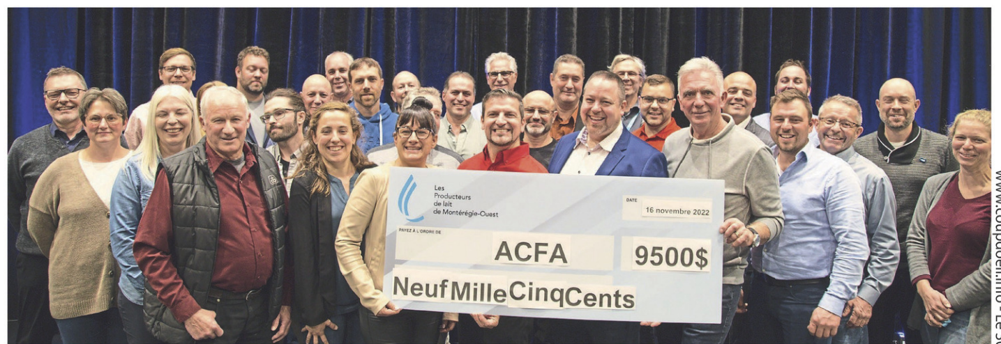
Ensemble, les Producteurs de lait de la Montérégie-Est et de la Montérégie-Ouest représentent 853 entreprises agricoles, selon l'UPA.

« Les Producteurs de lait de la Montérégie-Ouest et de la Montérégie-Est sont