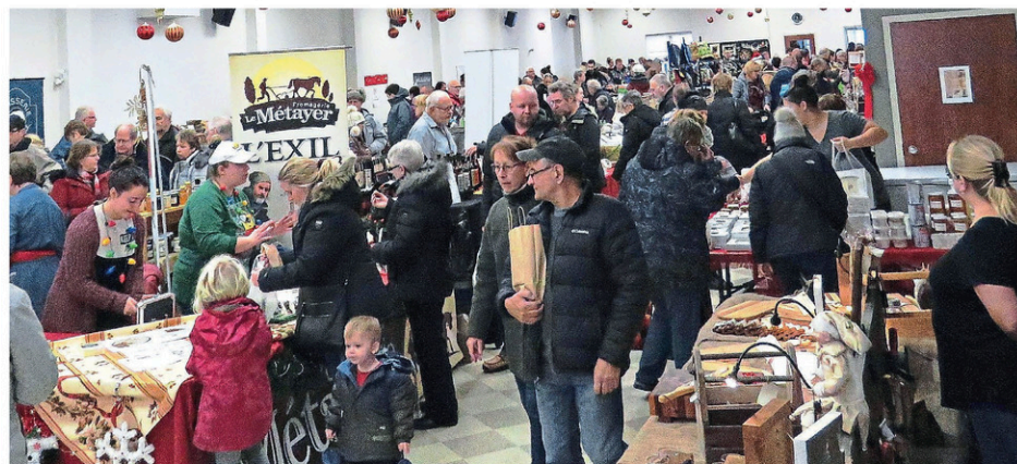
Pas moins de 45 exposants seront sur place, à l'intérieur et à l'extérieur du centre communautaire de Napierville.

Pour obtenir plus d'information, il faut composer le 450 245-3658 ou écrire un courriel à l'adresse loisirs@napierville.ca .