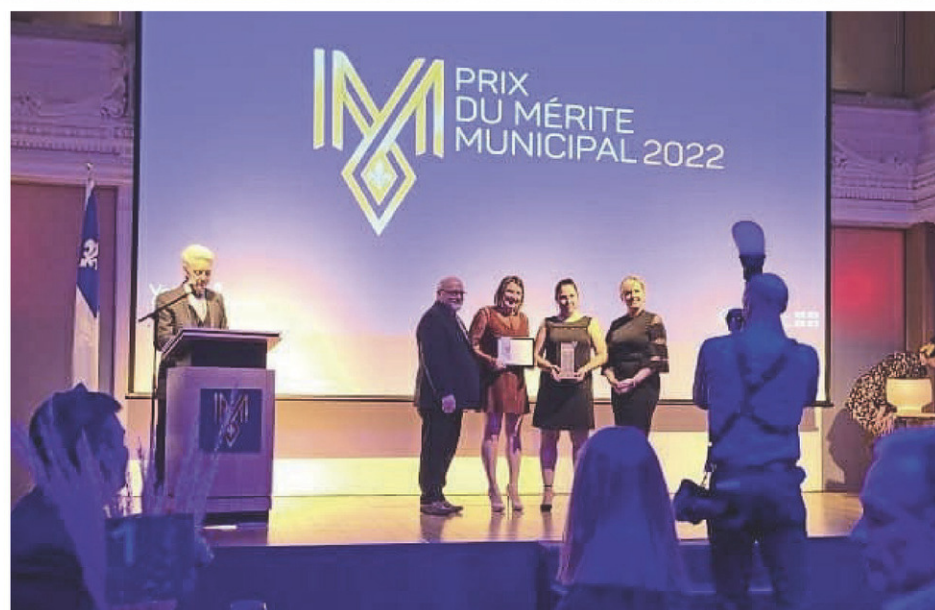
Sur scène, l'équipe de la friperie La Suite des choses, lors de la remise de leur prix.

« On envoie les jeans en mauvais état à une entreprise qui les recycle pour en faire de