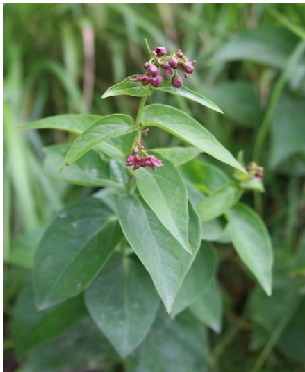
Le dompte-venin noir (genre : Vincetoxicum famille des Apocynacées)

Nous savons que ces températures au-dessus de la normale pourraient être courantes dans le futur et nous ne pouvons-nous réjouir de cette situation. Les changements climatiques ont, entre autres, des effets dévastateurs par l'arrivée de ravageurs exotiques tels que l'agrile du frêne et le scarabée japonais, le développement de nouvelles plantes envahissantes comme le dompte-venin noir et l'alliaire officinale, la perte de la biodiversité et la surconsommation d'eau.