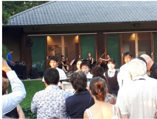
5 jeunes étudiants du Japon

À l'arrière scène, un quatuor de violonistes jouait des airs appropriés et solennels. Puis, un groupe de jeunes étudiants originaires d'écoles du Japon, rendait un témoignage touchant pour un avenir meilleur.