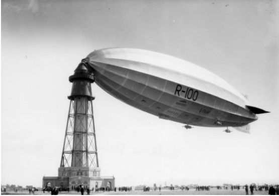
L'aéroport de St-Hubert