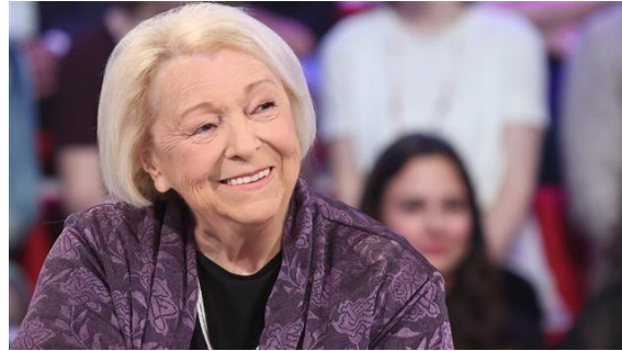
Lise Payette (29 août 1931- 5 septembre 2018)

Décédée tout récemment, à l'âge de 87 ans, madame Payette s'est fait connaître comme écrivaine, animatrice de télévision et de radio et femme politique. Elle a mené deux combats de front: la cause des femmes et l'indépendance du Québec.