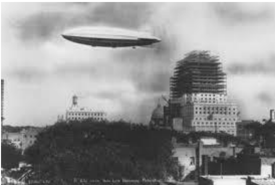
L'édifice de la Sun Life était en construction (2 e travaux importants : construction de la tour Nord de 26 étages)

Le voyage de 6,000 km se fit de Cardington près de Londres à St-Hubert en 78 heures et le retour se fit en 58 heures à cause des bons vents et du Gulf Stream.