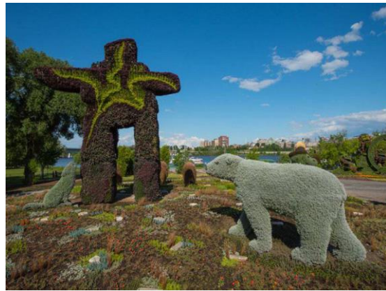
Inukshuk et ours