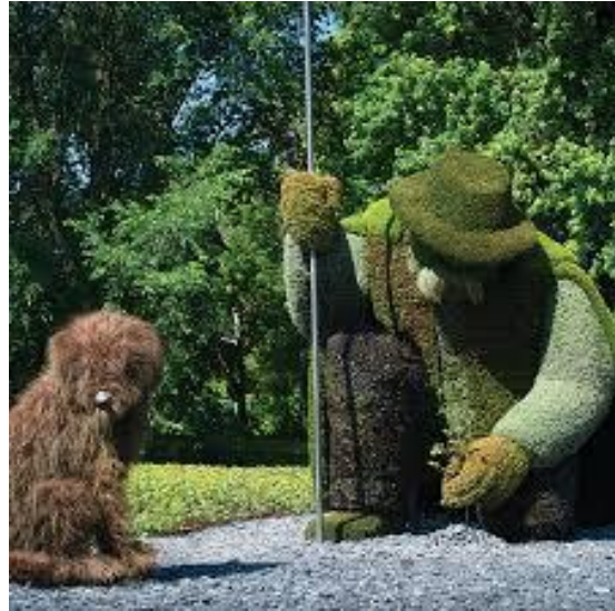
L'Homme qui plantait des arbres de Frédéric Back