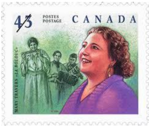
Mary Rose Anna Travers, dite La Bolduc

Mary Rose Anna Travers , dite La Bolduc, est née à Newport (à l'embouchure de la Baie des Chaleurs en Gaspésie) le 24 juin 1894 et elle est décédée le 20 février 1941 à Montréal. Mary Travers meurt à l'âge de 46 ans des suites d'un cancer à l'Institut du Radium de Montréal.