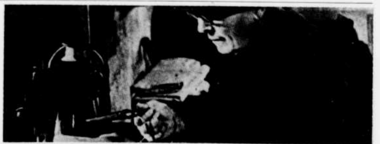
Le film à l'affiche de "Images en tête", samedi, "Farrebique", documentaire poétique de Georges Rouquier.