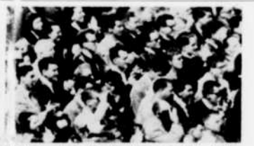
"Est-ce ainsi que les hommes vivent?", à la radio, du lundi au vendredi à 2 h. 30 de l'après-midi et à 10 h. 30 du soir.