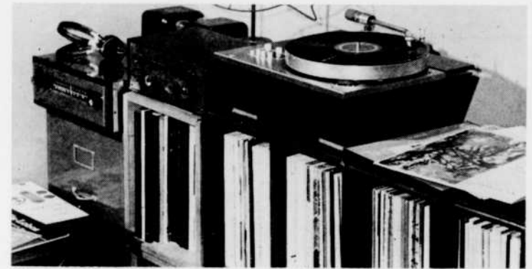
"Nouveaux disques", à 1 heure, chaque samedi.