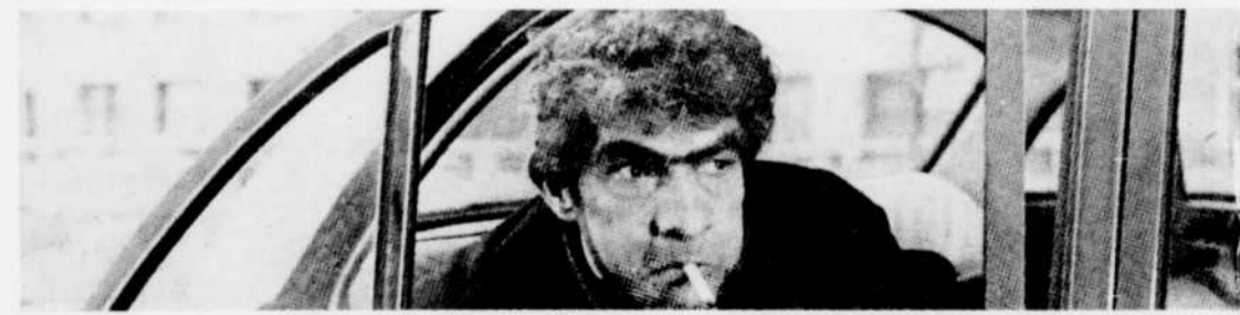
Un Jean-Louis Barrault méconnaissable dans "Le Testament du docteur Cordelier" (mardi, au "Festival Jean Renoir").