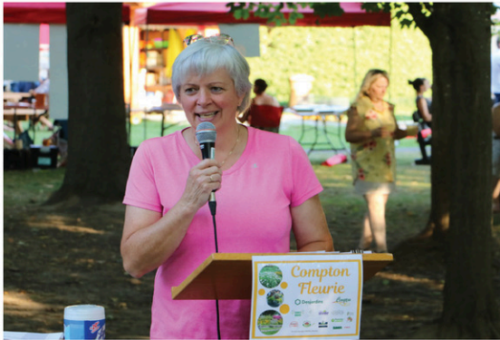
Un concours d'aménagement paysager, offert par le comité d'embellissement de Compton, pour fleurir la vie des gens d'ici.