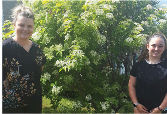
Un stage enrichissant à la municipalité de Saint-Isidore pour une étudiante, grâce au Carrefour jeunesse-emploi du Haut-Saint-François et au programme Apprenti-Stage.