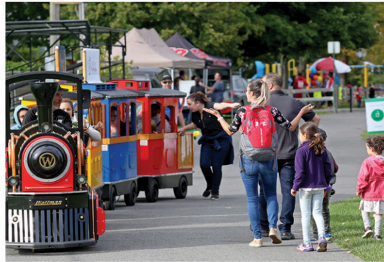
Une fête organisée par la MRC de Coaticook pour toute la population de la région afin de souligner la rentrée et de passer un bon moment ensemble.