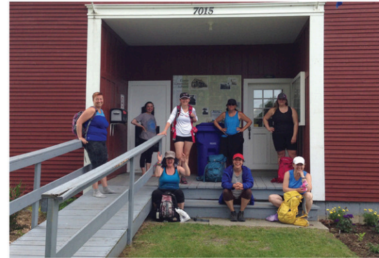
Un appui à l'organisme l'Éveil – ressource communautaire en santé mentale, afin de maintenir ses services durant la période estivale. L'événement 12 jours en juin , une marche sur la Voie des pèlerins de la Vallée de Coaticook, a permis d'amasser 24 240 $ pour l'organisme.