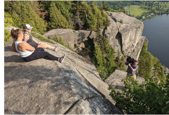
Les attraits atomiks Desjardins, une websérie réalisée par l'équipe de CIGN FM pour faire découvrir les bijoux touristiques de la MRC de Coaticook.