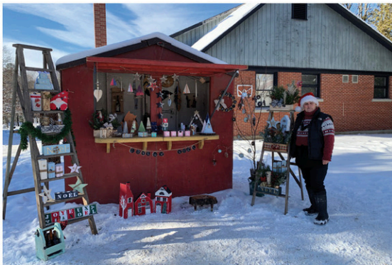
Un marché de Noël féérique dans le petit hameau de Way's Mill où exposants, contes, musique, activités intergénérationnelles et dégustations sont au rendez-vous.