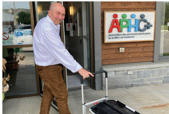
Un service de bibliothèque mobile, offert par la bibliothèque Françoise-Maurice, pour les aînés et les personnes à mobilité réduite de la région de Coaticook. La lecture, partout, chez nous!