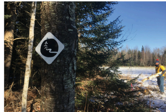
Un coup de pouce financier au Centre culturel et communautaire de Waterville pour le projet Accès-Nature. Parce que la vraie vie, c'est dehors!