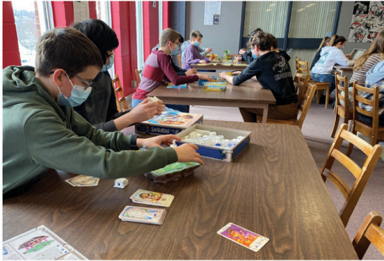
Des activités, des jeux de société et du matériel sportif pour les étudiants de l'école secondaire La Frontalière.