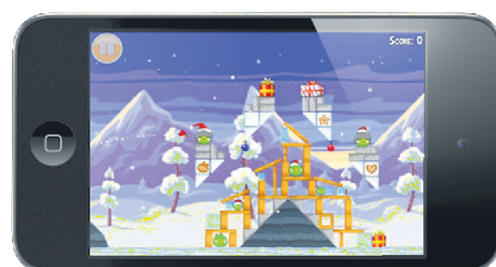
Application Angry Birds