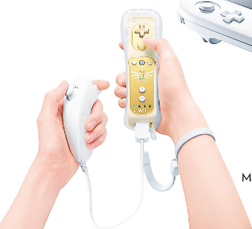
Manette Wii Motion