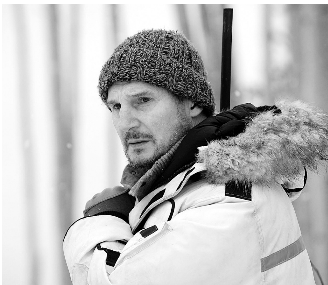
Liam Neeson, qui continue d'enchaîner les rôles à l'aube de ses 60 ans, est la tête d'affiche de The Grey .