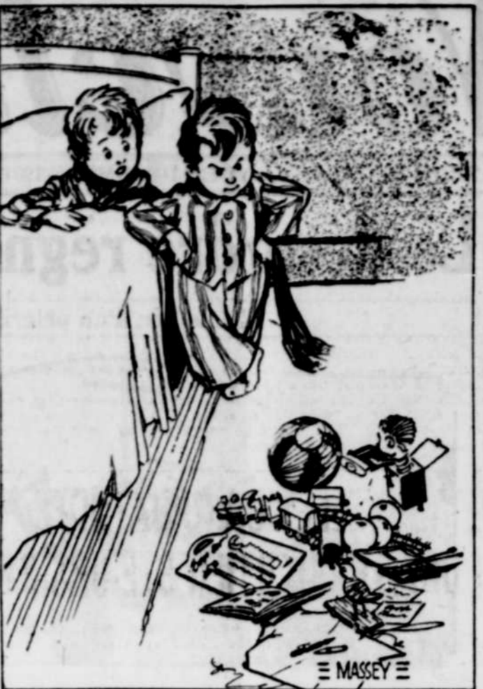
Mais je vois maintenant qui est le Père Noël. C'est M. Woolworth. —The Passing Show, Londres.