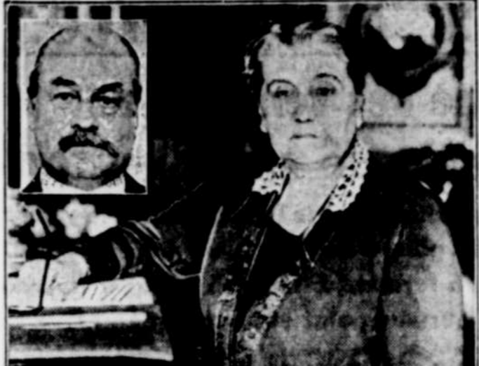
Miss Jane ADDAMS et le Dr Nicola Murray BUTLER, dans le médaillon, président de l'Université Columbia, qui se sont partagé le prix Nobel de la Paix d'une valeur de $46,350.