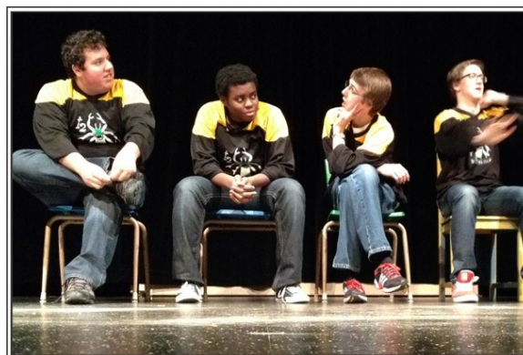
Spectacle d'improvisation des Bébés Volubiles à l'école D'Iberville dont les thèmes étaient tous tirés du monde de la littérature.