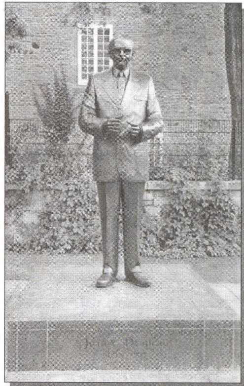
Monument de Jean Drapeau, place De La Dauversière, en face de l'hôtel de ville de Montréal

exprimée par sa famille, il n'en fut point question. Les gens ont été invités à se rendre à l'Hôtel de ville afin de signer le livre des condoléances. De plus, une messe solennelle de funérailles fut célébrée à la Basilique Notre-Dame.