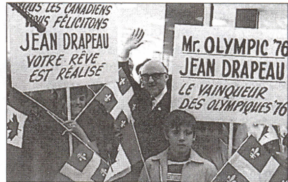
Jean Drapeau et les Jeux olympiques 1976 (ANC)

candidature de sa ville en 1970 pour les Jeux de 1976. Montréal est élue ville hôte aux dépens de Moscou. L'administration Drapeau engage l'architecte Roger Taillibert qui se charge de la construction du Stade olympique, où se déroulera l'événement. Après six ans de préparatifs, le Jeux débutent le 17 juillet: près de 75 000 spectateurs sont réunis pour les cérémonies d'ouverture et pour offrir une brillante ovation au maire Drapeau. Le lendemain, les diverses compétitions débutent dans 21 disciplines où s'opposent des milliers d'athlètes.