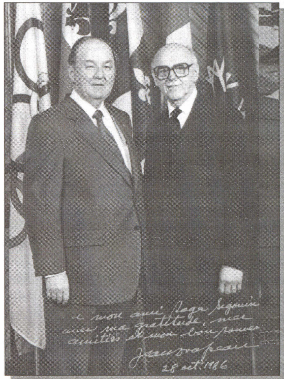
Roger Sigouin et Jean Drapeau à la fin du mandat du maire en 1986

Le nouveau premier ministre, Jean Lesage, l'assura de la possibilité de changer le mode de scrutin et de le rendre plus démocratique, en plébiscitant l'existence de la classe C, lors de l'élection de 1960. La population se prononce majoritairement pour l'abolition de la classe C. En 1962, toutes les classes d'électeurs sont abolies.