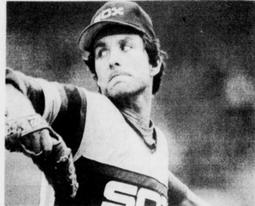
Floyd Bannister rapporte des dividendes après un départ pénible.