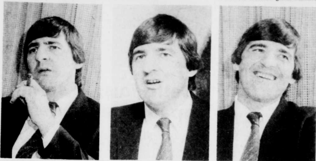
Serge Savard, le nouveau directeur-gérant des Canadiens de Montréal, était à Sherbrooke hier.

"Ce n'est quand même pas moi qui l'ai mis dehors. De toute façon, j'ai toujours été en très bons termes avec lui", a-t-il conclu.