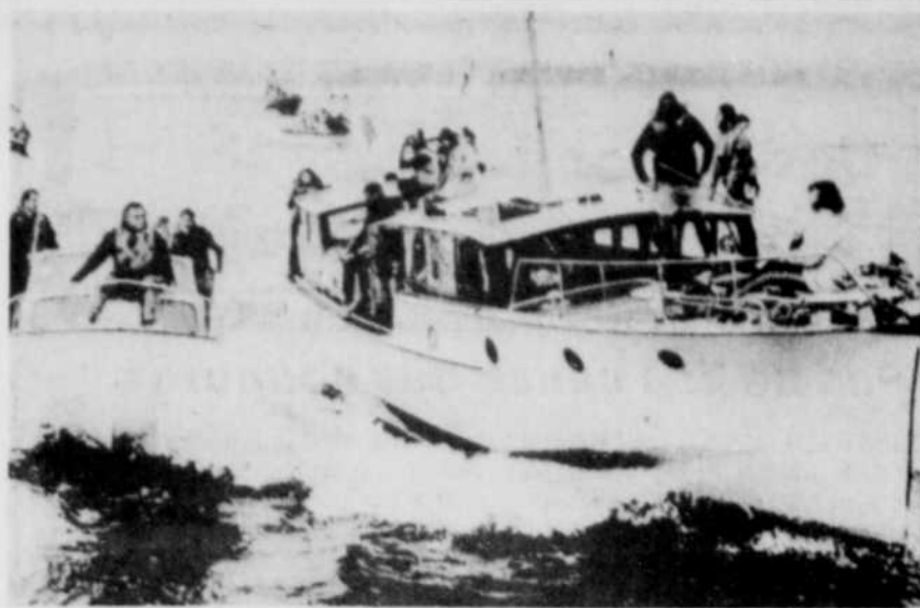
Contre le croiseur

Pour répondre à ces critiques, le secrétaire à l'Agriculture, M. John Block a voulu démontrer que l'on pouvait se nourrir convenablement avec l'aide fournie aux pauvres par le gouvernement.