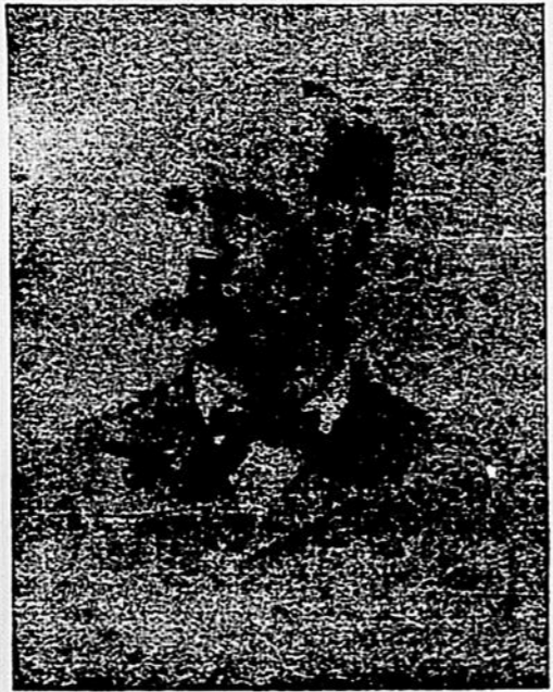
C. Beausoleil, Ecr.

Le député de Berthier est un des hommes les plus marquants de la chambre des Communes et l'un des principaux lieutenants de M. Laurier dans la Province de Québec. C'est un écrivain de mérite, un homme d'une grande instruction, très versé dans les matières d'économie politique et de finances et qui connaît à fond tous les rouages administratifs.