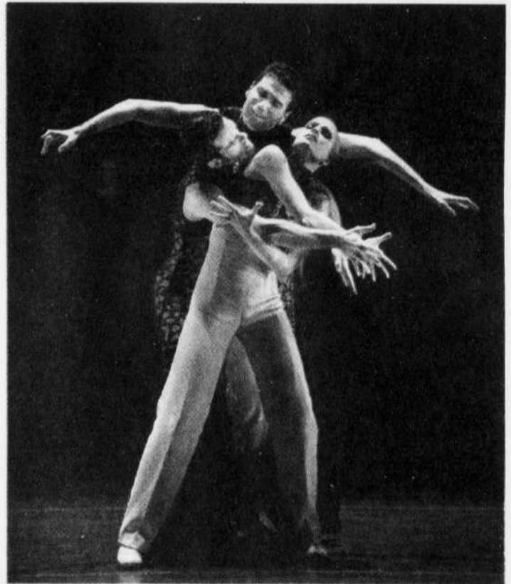
Une scène de la superbe pièce Ambigüedad , dont le chorégraphe Antonio Najarro est lui-même le pivot et qui met en scène un trio de deux hommes et une femme.