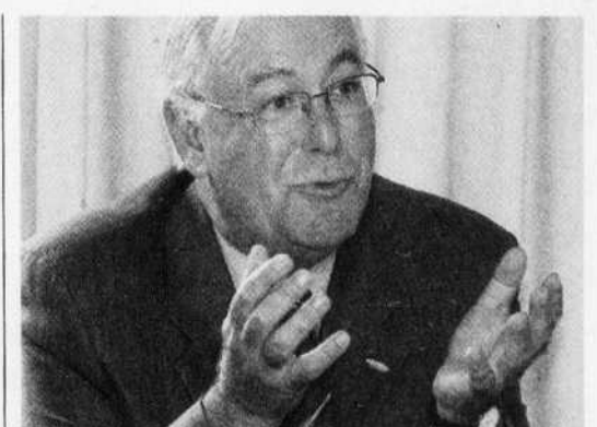
BUREAU DU COMMISSAIRE AU LOBBYISME DU QUÉBEC André C. Côté quittera demain son poste de commissaire au lobbyisme du Québec.