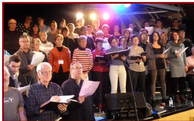
Les choristes de Choeur en hiver en répétition

Il s'agit d'une activité touristique-chorale qui se déroule sur 10 jours. Organisée à l'intention de choristes Français et Suisses, deux groupes y ont participé en février (50 choristes chaque fois en plus des choristes membres de Mouv'Anse). Le tout se déroulait au camp musical Saint-Alexandre de Kamouraska. L'activité comporte un volet touristique de cinq jours et un volet musical de cinq jours culminant par un concert au camp musical. Le répertoire est exclusivement la chanson francophone d'ici et d'ailleurs. Une activité qui permet la découverte d'un coin de pays sous la neige et qui a ravi les participants. Plusieurs chefs membres de l'Alliance y étaient pour l'un ou l'autre des séjours. Bravo Marc-André pour cette initiative.