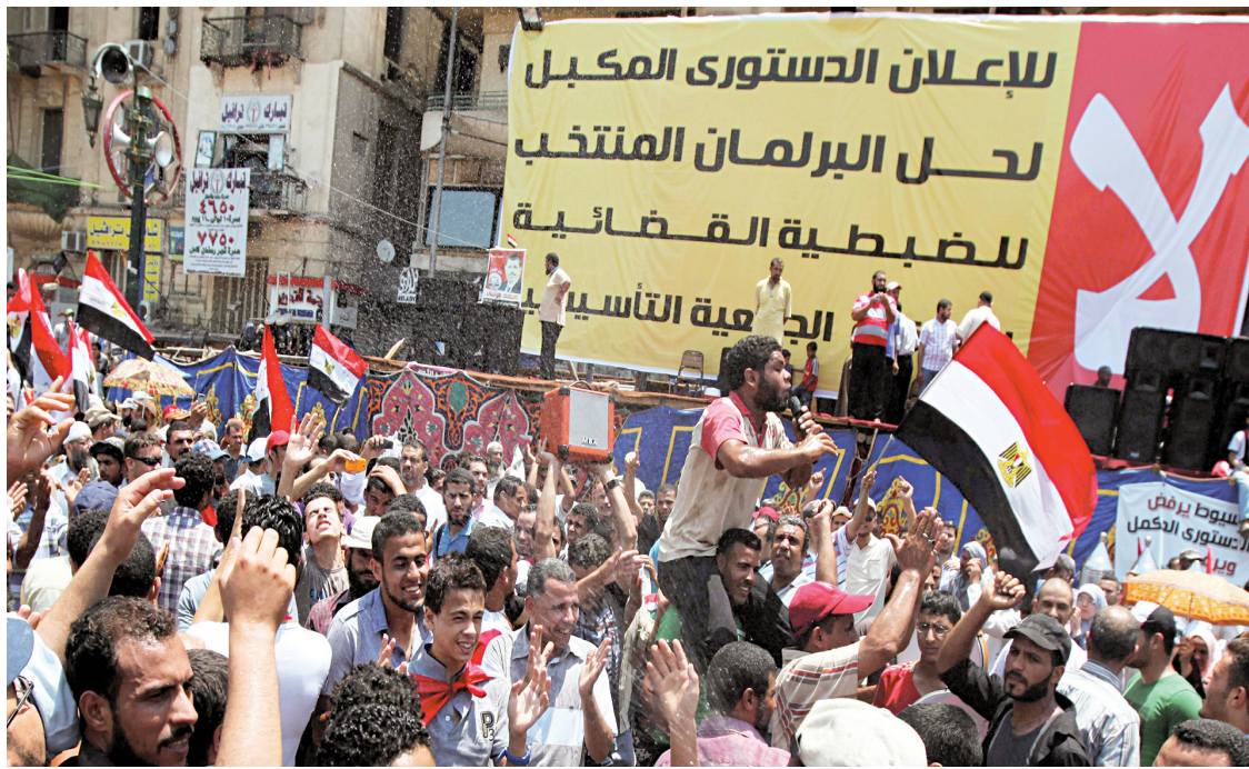
Les partisans du président élu ont conspué l'armée, hier, place Tahrir.

Elle est également indispensable pour élargir l'assise politique du président face au Conseil suprême des forces armées (CSFA), qui dirige le pays depuis la chute de M. Moubarak en février 2011 et doit remettre le pouvoir exécutif à M. Morsi avant la fin de la semaine le pouvoir exécutif.