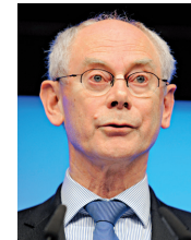
Herman Van Rompuy

Premier chantier: dessiner dès cette fin de semaine les contours d'une union bancaire à 27 qui reposerait sur une supervision renforcée, une mise en commun de la garantie des dépôts et un mécanisme commun de résolution des crises.