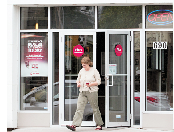
ADRIAN WYLD LA PRESSE CANADIENNE