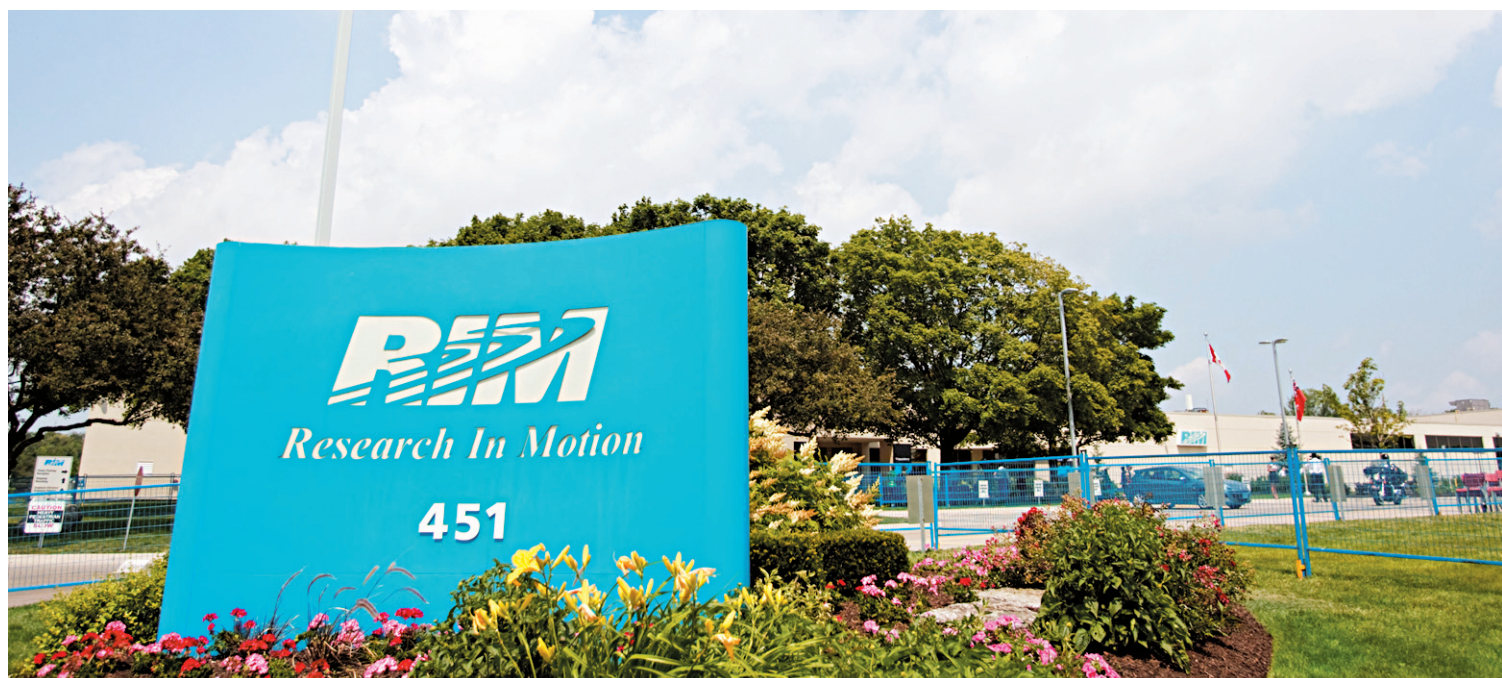
Le siège social de Research in Motion à Waterloo, en Ontario