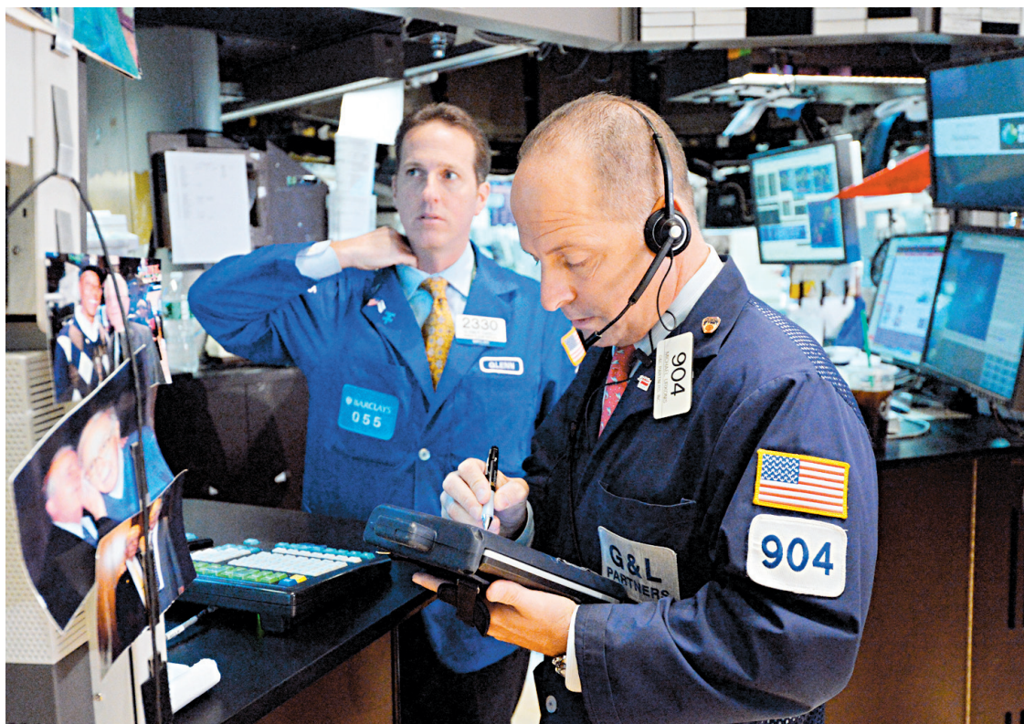
Des courtiers à l'œuvre à la Bourse de New York.

Les conseillers relèvent à l'échelle mondiale divers facteurs économiques qui menaceront l'économie canadienne dans l'année qui vient. Plus de la moitié d'entre eux (57%) déclarent qu'un ralentissement important de l'économie chinoise pourrait poser une menace pour le Canada au cours des douze prochains