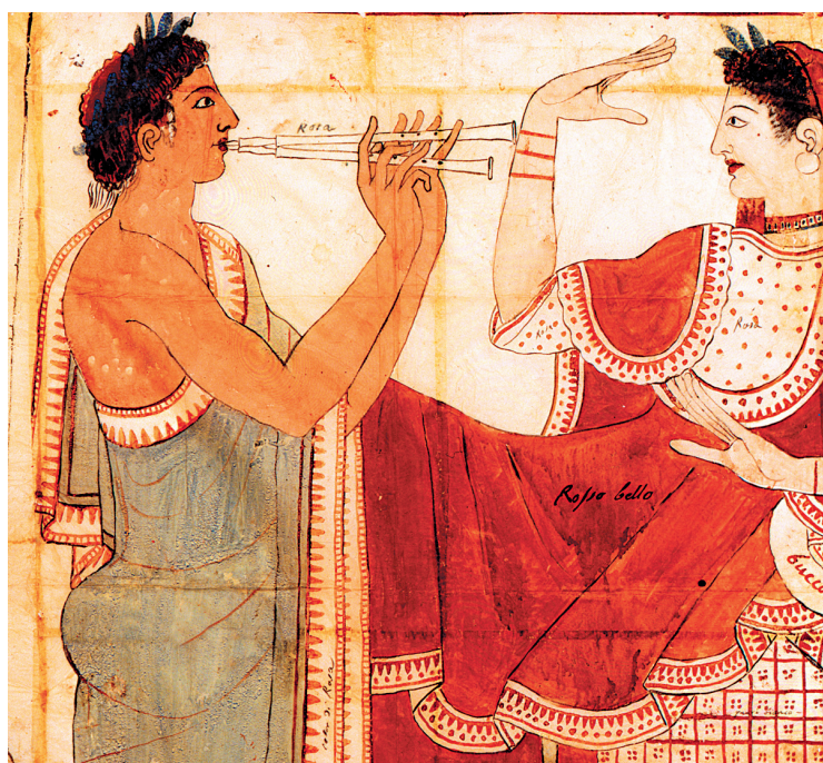
INSTITUT ARCHÉOLOGIQUE ALLEMAND, ROME

Aujourd'hui, les experts savent démêler le vrai du légendaire, surtout au sujet de l'origine du peuple, longtemps inconnue. Venu de l'est? Du nord? La thèse d'une origine autochtone nourrie des émigrations d'Asie Mineure et du Nord rallie de plus en plus de voix.