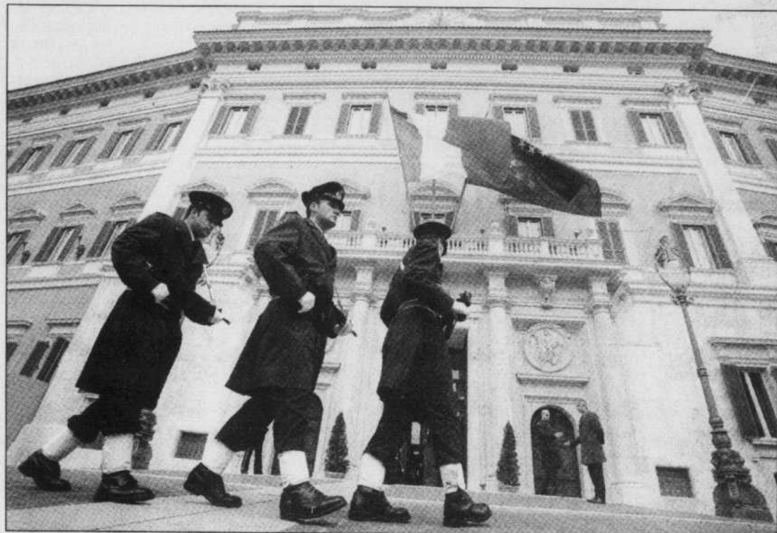
Membres de l'aviation italienne devant la Chambre des députés à Rome

Les neuf partis de la coalition se disputent quotidiennement depuis mai dernier sur des sujets allant de la prorogation de la présence militaire italienne en