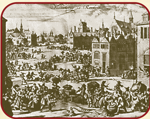
Embarquement à La Rochelle. Musée municipal de La Rochelle.

avec la plupart des engagés, deux d'entre eux s'étant cachés. Comme à l'accoutumée, la foule se masse sur le quai de la Grand Rive pour voir partir le voilier. Étienne a peine à repérer sa mère sur les remparts, ses frères lui font de grands signes de la main. Peut-être notre adolescent cherche-t-il des yeux quelqu'un pour un tendre adieu? Lui seul pourrait le dire. Peu à peu, les tours de La Rochelle et la côte française s'estompent pour disparaître tout à fait.