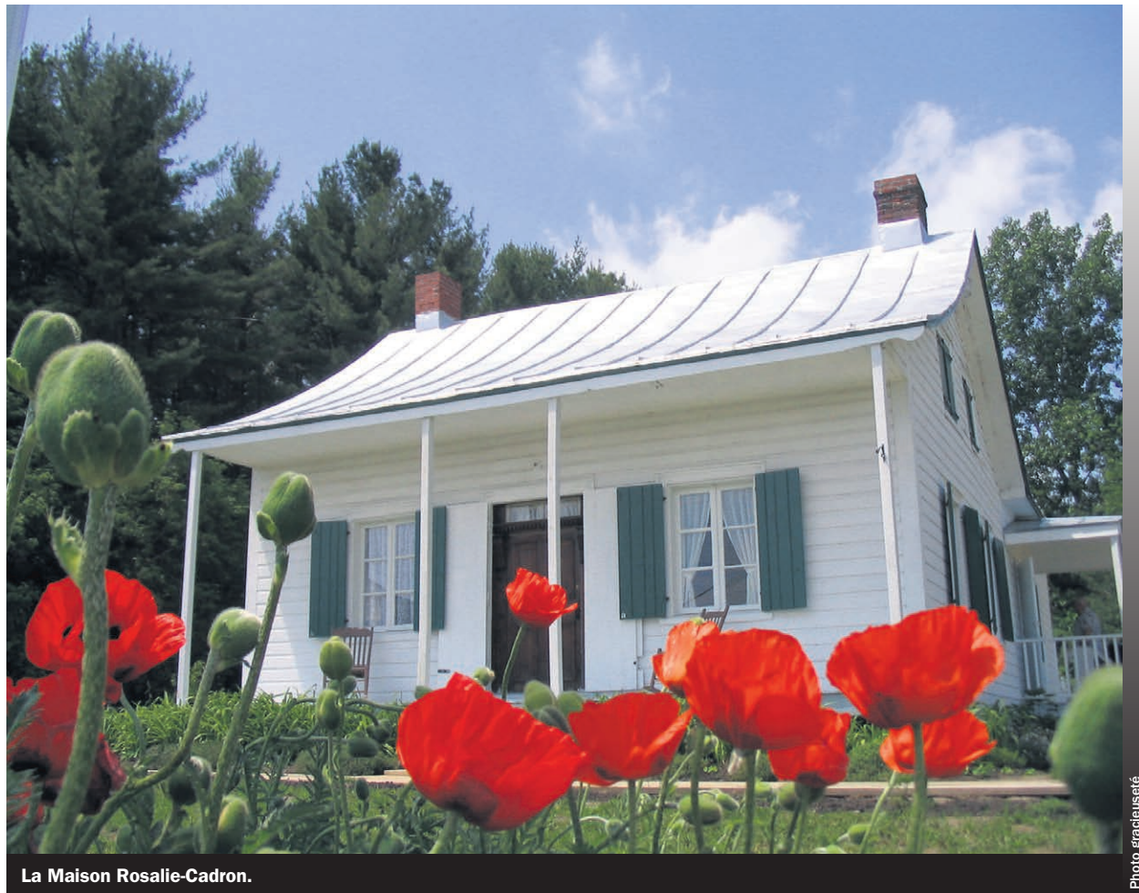
La Maison Rosalie-Cadron.

La Maison Rosalie-Cadron est située au 1997, rue Notre-Dame à Lavaltrie. Pour l'horaire complet de la journée: www.maisonrosaliecadron.org . (EB)