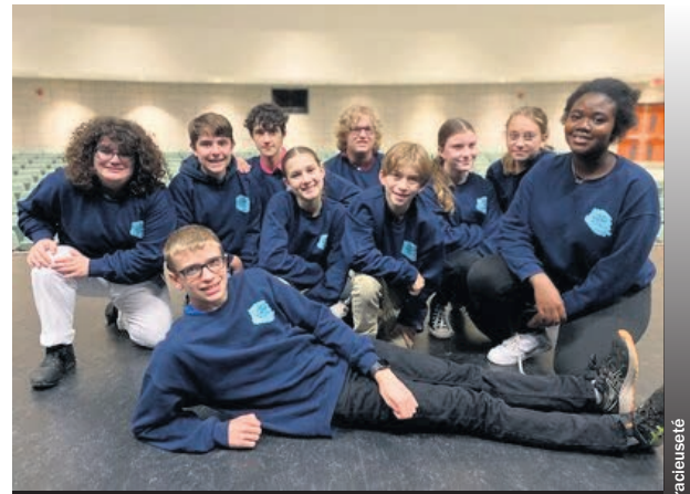
Les membres du conseil d'élèves de l'école secondaire Pierre-de-Lestage.

Au cours de l'année scolaire 2023-2024, le programme Vox populi a soutenu les conseils d'élèves de plus de