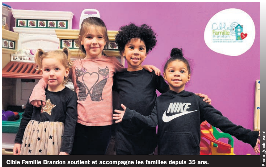
Cible Famille Brandon soutient et accompagne les familles depuis 35 ans.