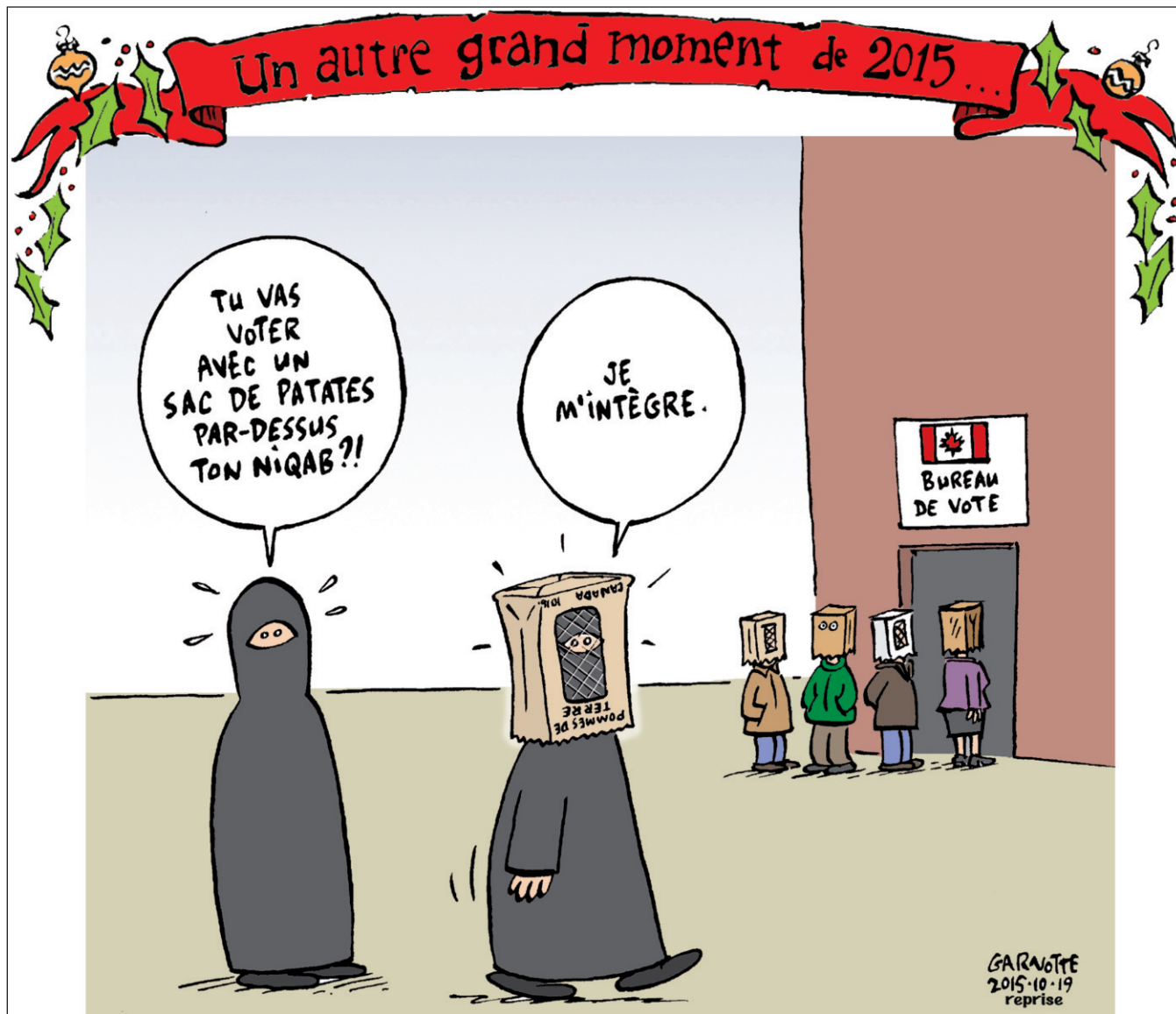
GARANTIE 2015-10-19 reprise