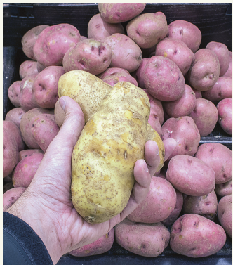
MICHAËL MONNIER LE DEVOIR Il a fallu du temps pour que la patate soit considérée comme une culture horticole digne de ce nom.

Pourtant, la pomme de terre est d'abord boudée: au XVII e siècle, on la croit