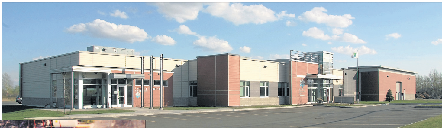
Le siège social actuel de la CAM, au 7325, boulevard Jean-XXIII à Trois-Rivières.