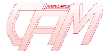
Premier logo de la CAM lors de sa création.

acquis de Lépine-Cloutier sous forme de coopérative de travail : c'est ainsi que démarrait le 1er avril 1989 le début de l'histoire de la Coopérative des ambulanciers de la Mauricie, mieux connue par le public sous le nom de la CAM qui dure depuis vingt-cinq ans.