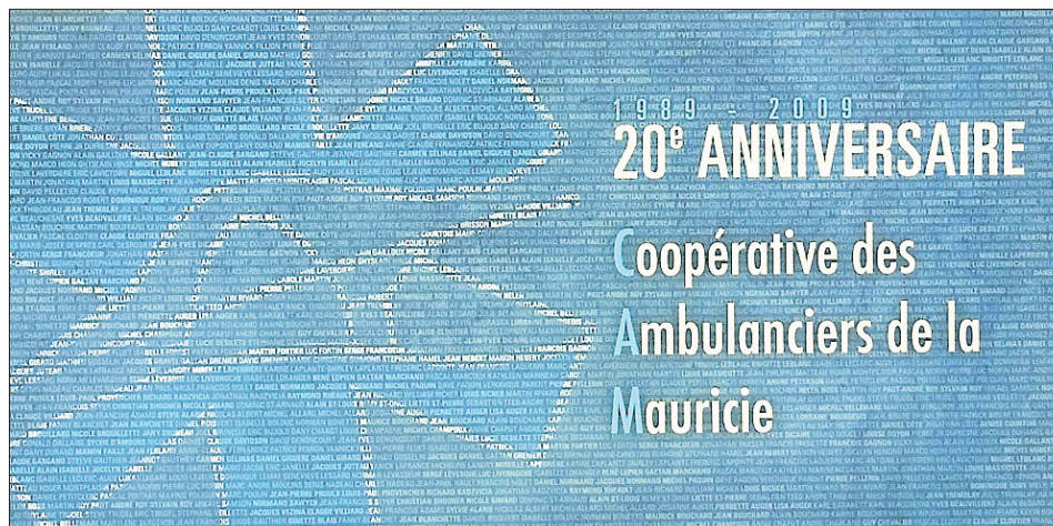
Tableau créé à l'occasion du 20e anniversaire en 2009.

La vision de la CAM est celle d'être reconnue par les communautés desservies comme une entreprise assumant pleinement son rôle et par tous les groupes d'intervenants et d'organismes de la chaîne des services préhospitaliers d'urgence tant au niveau provincial, régional que local comme un partenaire professionnel hors-pair centré sur la qualité du service au client et prônant une approche « gagnant-gagnant ».