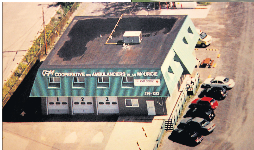
Le premier siège social de la Coopérative des ambulanciers de la Mauricie, acquis en 1989.