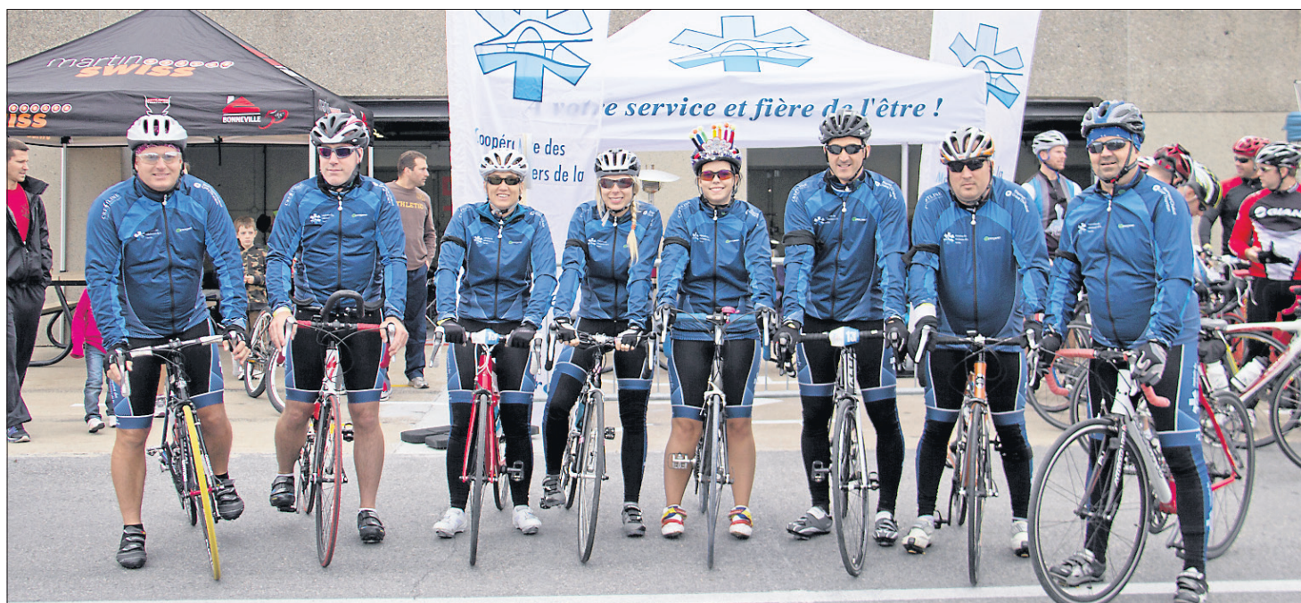
Participation de la CAM au défi 911 en 2013.

La CAM participe aussi régulièrement à des salons carrières et professions et effectue également avec ses membres paramédics des visites dans les écoles afin de familiariser les jeunes à la profession de paramédic.