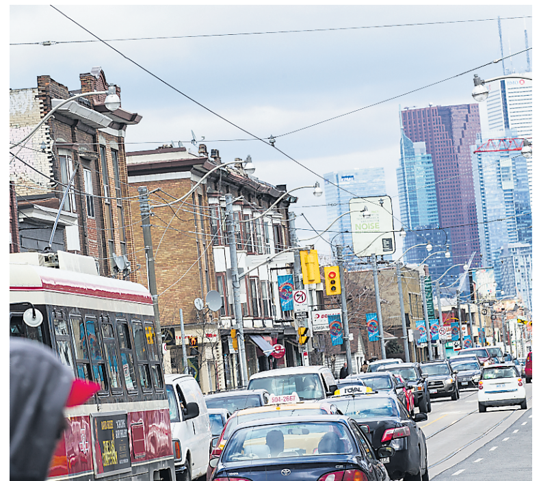
Photo de la rue Dundas Ouest avec le centre-ville de Toronto en arrière-plan.

Départs de Québec. Applicable pour les nouvelles réservations effectuées d'ici le 6 novembre 2015. Les économies de 100 $ par couple sont reflétées dans les prix affichés. Les prix sont par personne, en occupation double, pour des forfaits vacances de 7 nuits (sauf indication contraire). Les sièges et les chambres aux prix ci-haut sont limités, la capacité est contrôlée et est disponible au moment de l'impression. Les prix n'incluent pas la contribution des clients au Fonds d'indemnisation des clients des agents de voyages de 1,00 $ par tranche de 1 000 $ de services achetés. Les taxes locales applicables sont payables à la destination et sont à part (RD 30 $ US, Panama 43 $ US). Les vols sont sur Sunwing Airlines. Le service en vol varie selon l'heure de vol et la destination. Pour les modalités et conditions complètes, veuillez vous référer à la brochure de Vacances Signature 2015/2016. Sunwing Tours Inc. opérant sous la bannière Vacances Signature. Titulaire d'un permis du Québec | 31/10/2015