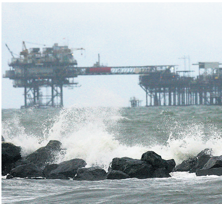
L'exploitation pétrolière est l'une des industries les plus lucratives en Louisiane.

L'exploitation pétrolière est l'une des industries les plus lucratives en Louisiane. C'est d'ailleurs dans cet État que la première plateforme pétrolière