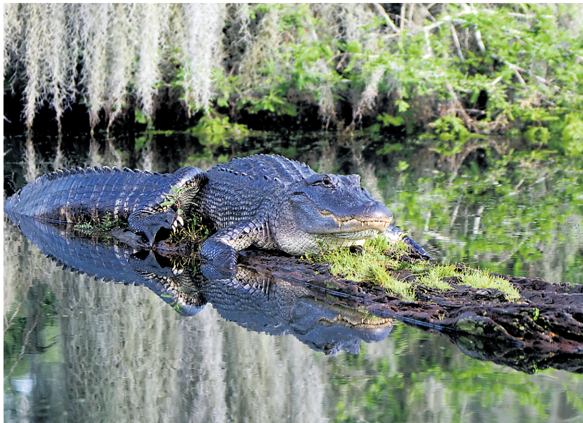
Il n'est pas rare de voir des alligators dans les marécages de la Louisiane.

Il y a La Nouvelle-Orléans et son ambiance festive. Mais la Louisiane offre aussi une multitude d'activités à faire en plein air pour profiter de la température clémente, de la flore luxuriante et de la faune étonnante. Voici cinq suggestions.