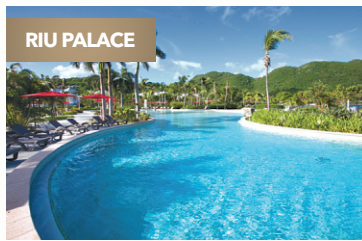
Saint-Martin ★★★★★ Riu Palace St Martin Suite junior vue jardin 14 déc.