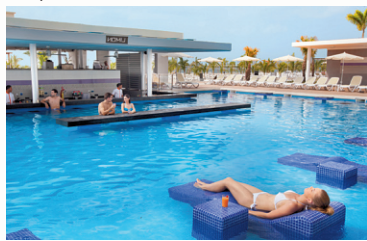
Panama ★★★★★ Riu Playa Blanca Chambre vue court 27 nov. et 4 déc.

Départs de Québec • Une Semaine • Tout compris