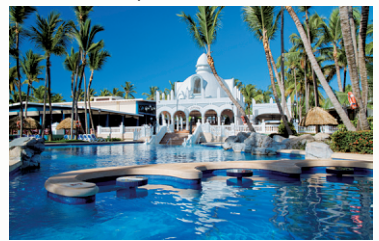
Punta Cana, R.D. Riu Bambu ★★★★★ Chambre 12 et 19 janv.