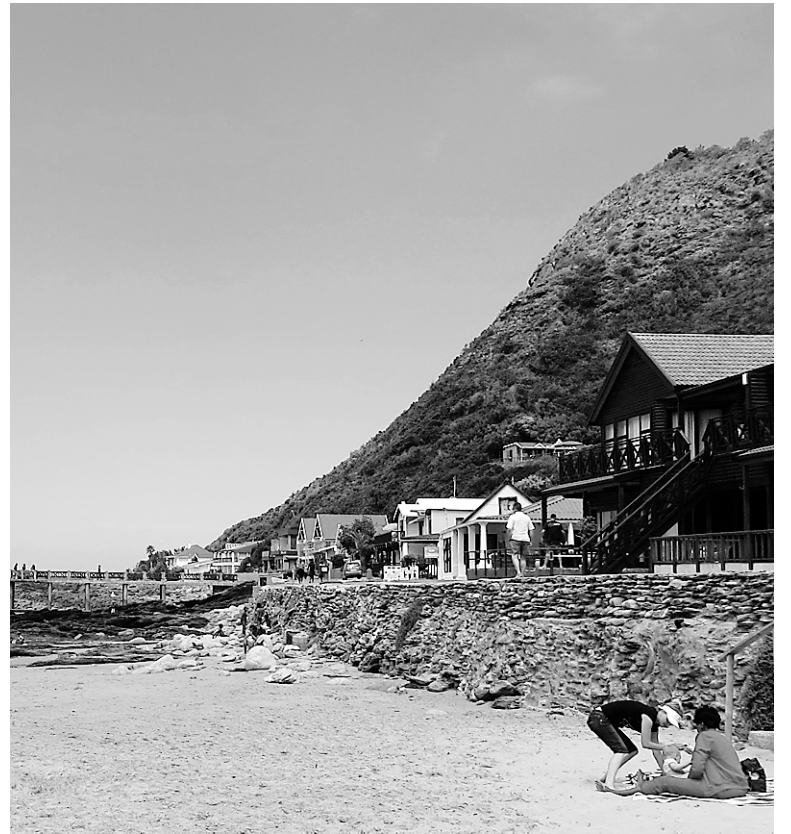
Je suis très reconnaissant au surveillant du stationnement de la plage de Victoria, en Afrique du Sud. Nos passeports, nos appareils électroniques, tout était encore à sa place à notre retour, et ce, même si nous avions oublié de verrouiller les portières.

Pour débarquer sur la plage, nous n'avions évidemment pas emporté tous nos objets de valeur, que nous avions tout de même été assez brillants pour camoufler dans le véhicule. Après une heure au soleil, nous sommes retournés au stationnement, toujours avec le surveillant insistant qui nous suivait.