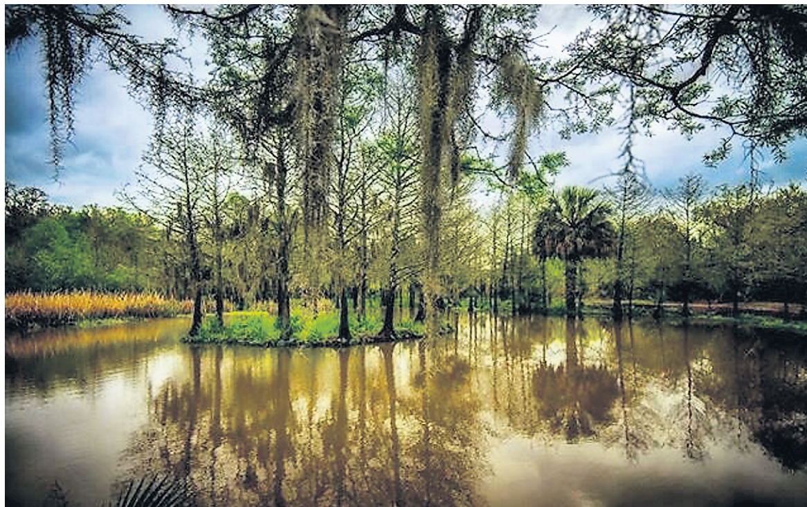
À Avery Island se trouve un havre de paix nommé Jungle Garden. Cette réserve ornithologique comprend une multitude d'espèces de plantes provenant de partout dans le monde — PHOTO TIRÉE DE LA PAGE FACEBOOK DE JUNGLE GARDEN

Tabasco (l'usine est voisine du jardin), cet espace inspire le calme grâce à ses grands chênes et à son bouddha géant vieux de plus de 800 ans. Sillonnez les sentiers derrière le volant et quittez votre véhicule pour faire de petites promenades à travers les arbres ou près des marécages. Vous pourriez rencontrer des hérons, des chevreuils... ou un alligator. Notez qu'il faut payer 1 $ pour accéder à l'île en plus des frais d'entrée de 8 $ pour adultes et de 5 $ pour enfants.