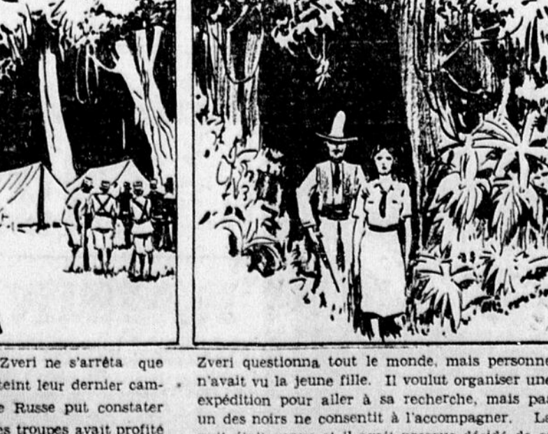
La déroute des forces de Zveri ne s'arrêta que lorsque les noirs eurent atteint leur dernier campement, et même alors le Russe put constater qu'un quart au moins de ses troupes avait profité de l'occasion pour désertir. Il découvrit également que Zora et Romero manquaient à l'appel.