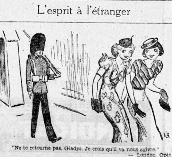
"Ne te retourne pas, Gladys. Je crois qu'il va nous suivre."

Au cours des discours, les orateurs ont affirmé l'union profonde dans le domaine spirituel entre la Catalogne française et espagnole.