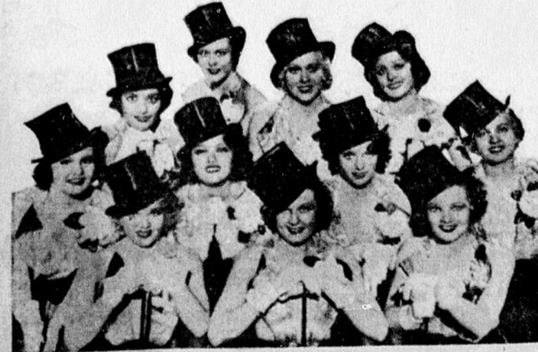
Onze beautés de EARL CARROLL que l'on peut voir dans "MURDER AT THE VANTIES" au CAPITOL aujourd'hui et demain avec RICHARD ARLEN et SALLIE EILERS dans "SHE MADE HER BED".