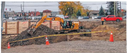
Élite Ford s'étendra sur 38 000 pieds carrés, une fois les agrandissements terminés.