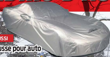
AUSSI Housse pour auto