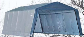
Abris : 12 x 24 x 8 pi