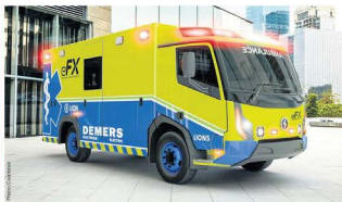
L'un des deux modèles d'ambulance électrique qui a été présenté.

Équipe Laurence est une firme spécialisée en génie civil, implantée à Piedmont depuis 1983, et ayant 6 autres places d'affaires à Boisbriand, Montréal, Joliette, Gatineau, Rivière-Rouge et Mont-Laurier. L'entreprise est en pleine expansion et est formée de plus de 90 personnes.