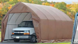
Abris : 13 x 20 x 12 pi