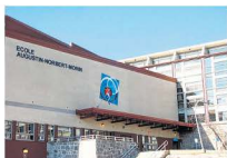
Trois adolescents ont été arrêtés par les agents de la SQ des Pays-d'en-Haut, à l'école secondaire, A.-N. Morin.