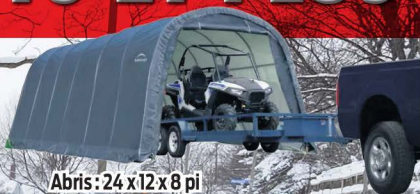
Abris : 24 x 12 x 8 pi