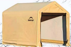
Abris : 6 x 6 x 6 pi