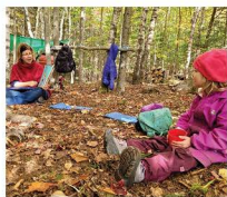
Le petit club est une activité automnale pour les enfants de 4 à 5 ans qui souhaitent s'initier à l'aventure en forêt.

Mme Chabot dit qu'un milieu naturel convient mieux à son garçon, énergique et hypersensible, qu'une garderie. Les néons, le bruit dans les classes et les écrans sont agaçants pour lui. « La nature vient l'apaiser. Les stimuli en nature sont plus agréables que de la nature première d'un enfant », croit-elle.