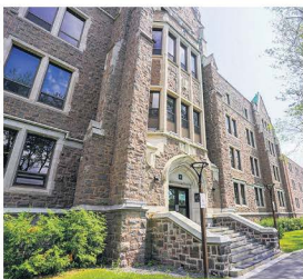
Le Cégep de Saint-Jérôme.

Le QGDA offrira un lieu pour expérimenter, un peu comme le centre de simulation actuellement utilisé en soins infirmiers. Une chambre d'hôpital est recréée et les étu-