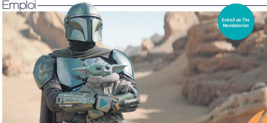
Extrait de The Mandalorian