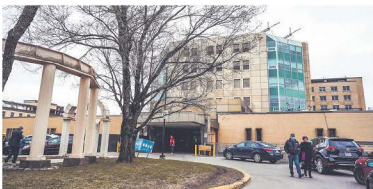
Hôpital de Saint-Jérôme