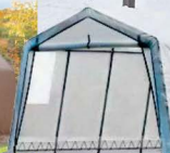
Abris : 11 x 20 x 8 pi