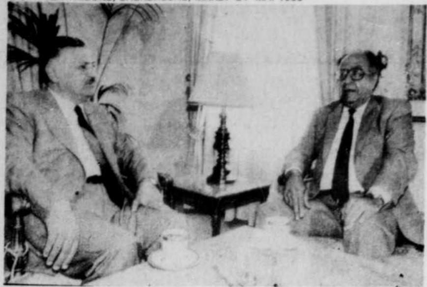
L'émissaire américain Philip Habib s'est entretenu hier avec le premier ministre libanais Shafik Wazzan dans leurs efforts pour concrétiser les accords sur le retrait des troupes étrangères du Liban.