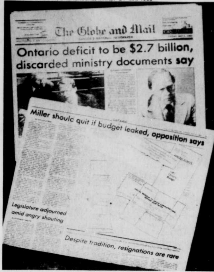
Les révélations du Toronto Globe and Mail, du 6 mai dernier, sur le budget de l'Ontario, continuent à provoquer une foule de commentaires variés sur la responsabilité de cet incident.