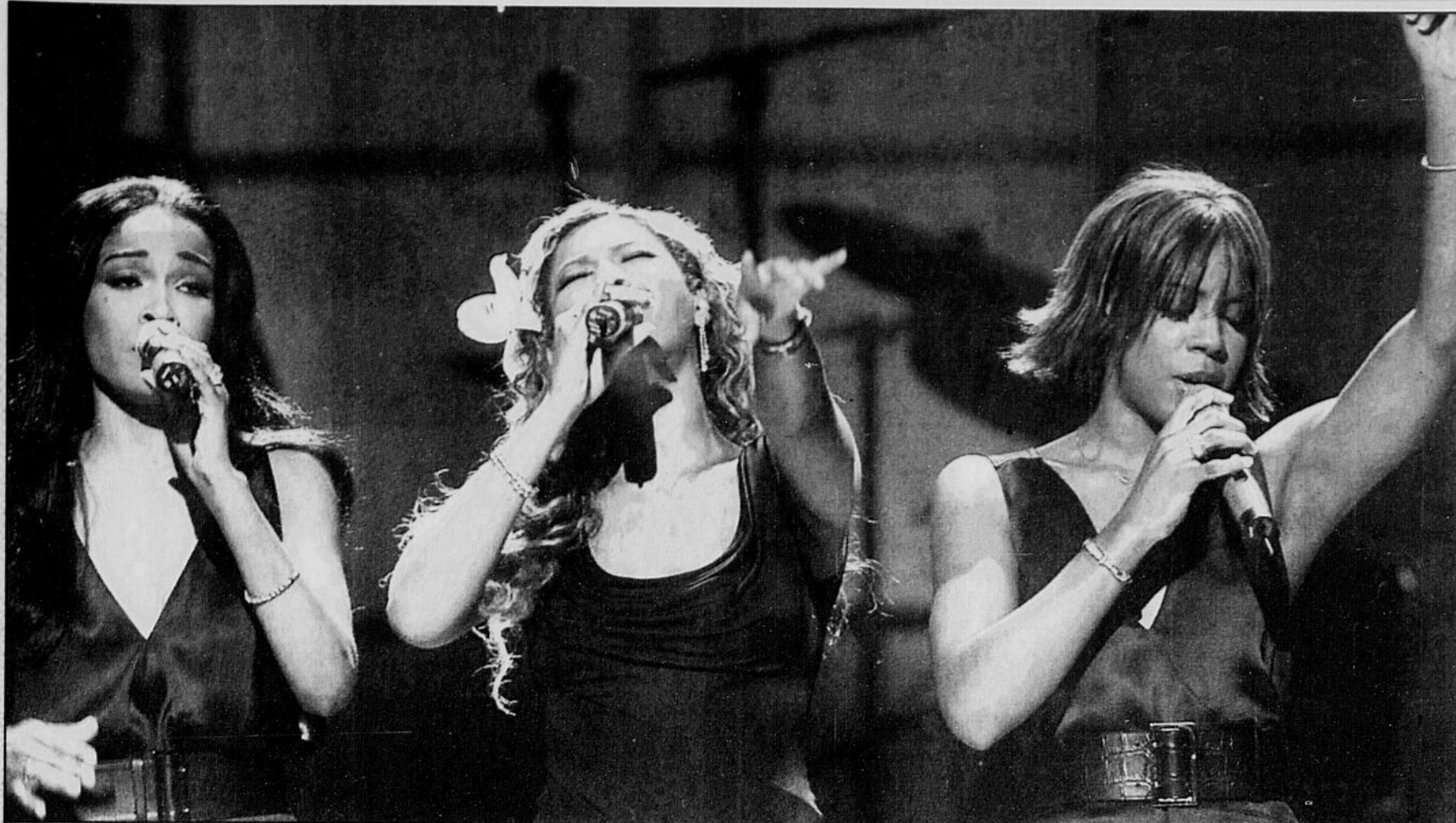
Aux côtés des artistes dont la renommée est établie depuis des décennies, les idoles des jeunes ont aussi chanté à New York. C'est le cas, par exemple, de Destiny's Child.