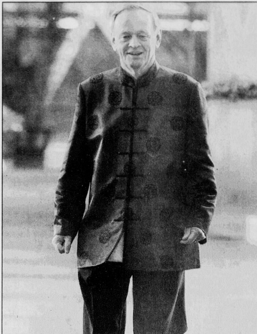
Jean Chrétien portait le veston de soie traditionnel chinois au moment de son arrivée au sommet de l'APEC à Shanghai, hier.

Les forces militaires canadiennes sont sur le point de contribuer directement aux frappes contre l'Afghanistan, qui ont jusqu'à maintenant été menées par les Etats-Unis et la Grande-Bretagne.