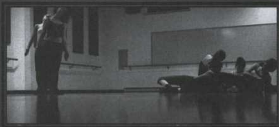
Gagnantes de la Finale nationale 2001

Au programme, « Les filles qui ont carriotté », « Le Général Trou-du-Cul », « La Farole est d'or » et une foule d'autres histoires méconnues issues de la tradition populaire que le public explore au rythme dynamique de la narration du conteur. Un spectacle où le cabotinage et le plaisir sont toujours au rendez-vous !