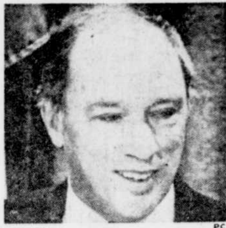
Un peu de lassitude perçait, hier, pendant la conférence de presse du premier ministre Trudeau.

Trudeau rencontrait la presse hier au cercle national pour la première fois depuis trois semaines. Les journalistes ont été surpris de