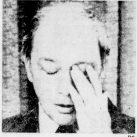
Un peu de lassitude perçait, hier, pendant la conférence de presse du premier ministre Trudeau.

sa calme froideur. Un anglophone lui pose une longue question sur son succès constitutionnel. Les caméras de la télévision se préparaient à tour-