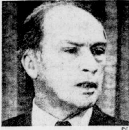
Un peu de lassitude perçait, hier, pendant la conférence de presse du premier ministre Trudeau.