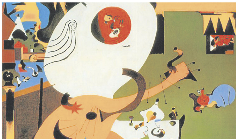
Intérieur hollandais I, Joan Miró, 1928

Bref, je suis une personne compliquée... Et fière de l'être.