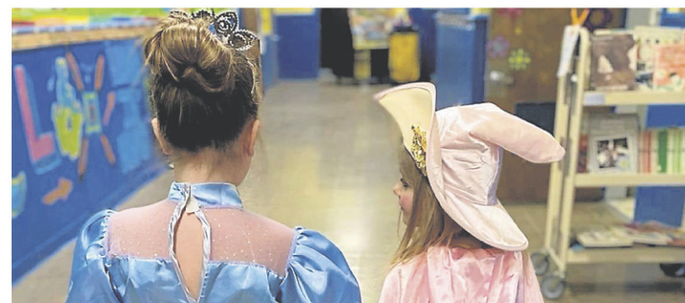
Le tournage d' Adventures in Fairy Tales a permis d'englober toutes les compétences du programme préscolaire à la Waterloo Elementary School.

Tout a été filmé par M me Barr sur des iPhone. L'enseignante a également fourni les costumes, réalisé le