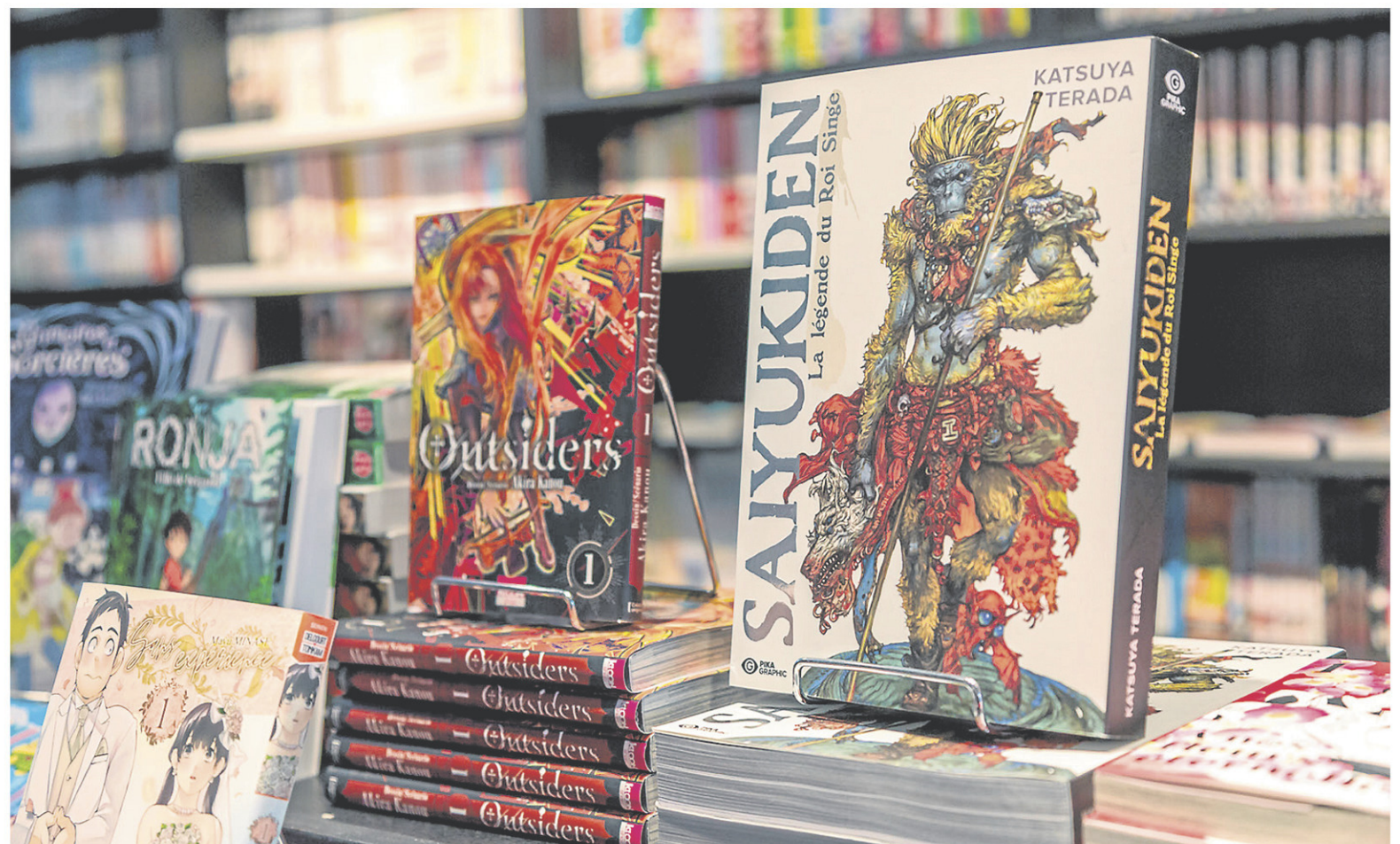
Le manga rassemble quatre grandes catégories : Shōnen et Shōjō, qui visent un public adolescent ; Seinen pour les adultes ; et Kodomo, qui s'adresse aux enfants. Shōnen est celle qui regroupe les titres les plus populaires.

Oui, on veut en avoir davantage. On va d'ailleurs en compter deux autres dans un mois en Abitibi-Témiscamingue, à Rouyn-Noranda et à Val-d'Or.