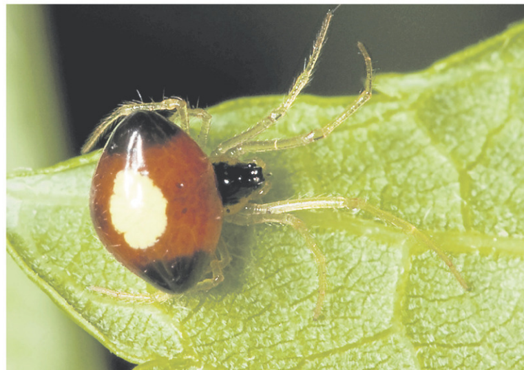
La femelle Theridula emertoni a l'apparence d'une minuscule perle rubis, ponctuée en son centre d'une tache jaune vif, et dotée de pattes translucides et dorées.

Là, cette feuille étrangement recourbée cache probablement quelque surprise. Recroquevillée par la tension de fils minuscules, elle prend la forme d'un hamac inversé. En la retournant, une petite chose délicate s'y déplace, une perle rubis, ponctuée en son