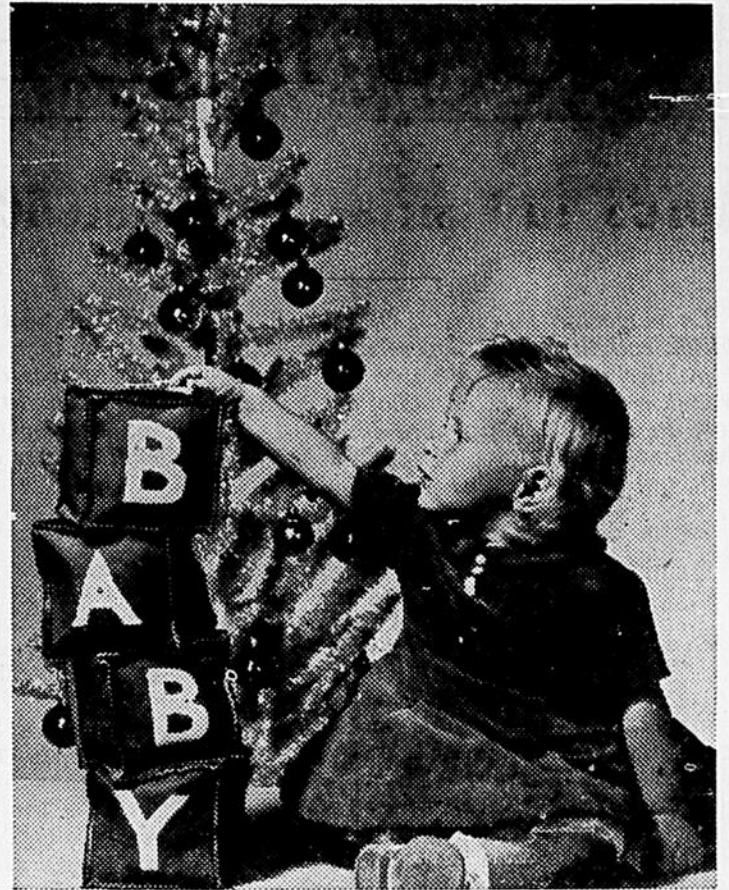
QUEL PLAISIR QUE D'APPRENDRE A LIRE d'après ces charmants blocs en feutre rouge qu'un bon ange a gracieusement placés dans le bas de Noël! Les lettres de l'alphabet, découpées d'un feutre blanc, sont cousues sur les blocs rembourrés de kapok et qui peuvent être de différentes grandeurs. C'est un projet de la maison Singer.