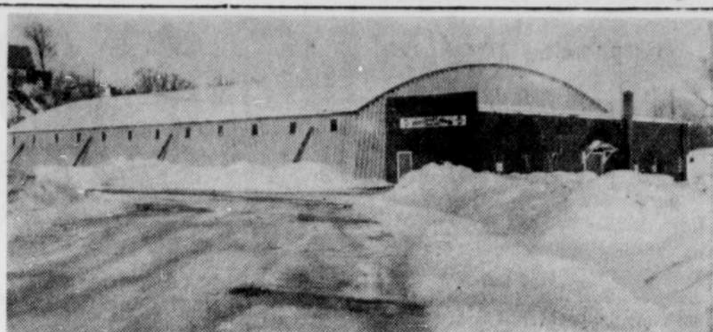
L'ARENA DU COLLEGE DE STANSTEAD qui est située dans le territoire de la ville de Rock Island est maintenant terminée. Le 18 janvier 1969 le toit s'était effondré. Depuis ce temps, un nouveau toit a été fixé de même qu'une machine à faire la glace et tout l'intérieur de l'arena. C'est la compagnie Williams Construction de Sherbrooke qui a exécuté les travaux de réparations. L'arena est actuellement ouverte, et les dirigeants du hockey mineur de la région sont bien satisfaits.

Succès à l'initiation des Chevaliers de Colomb! CLAUDE G. GOSSELIN Ministre des Terres et Forêts du Québec Député de Compton à l'Assemblée Nationale