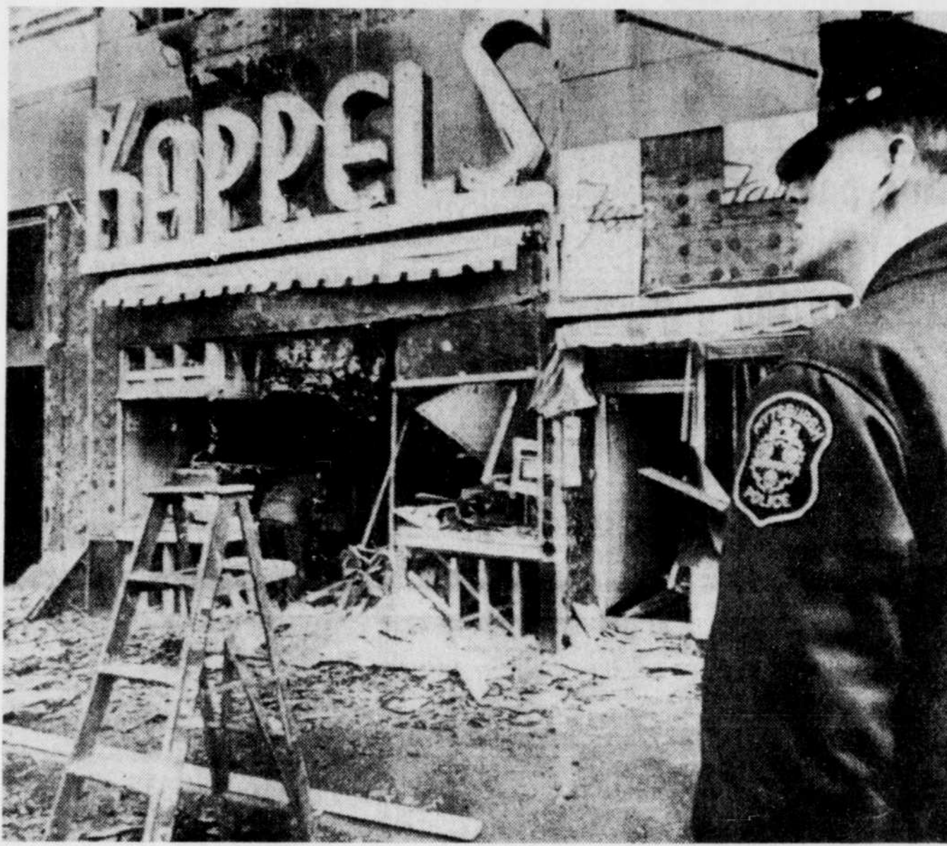
UNE BOMBE — Les attentats à la bombe, qui ont semé la panique à New York, ont touché aussi d'autres villes américaines, telles que Pittsburgh où un centre d'achat a été ravagé par l'explosion de ce qu'on croit être une bombe, hier matin. Une bijouterie a été détruite et au moins 22 autres boutiques ont été endommagées par l'explosion.

NEW YORK, (AFP) — Le commando gauchiste qui s'intitule lui-même "Groupe révolutionnaire numéro 9" n'a peut-être pas atteint tous ses objectifs mais il a néanmoins réussi à semer la pagaille, sinon le désarroi, dans les administrations des grandes sociétés commerciales de New York et dans l'appareil judiciaire de la grande ville.