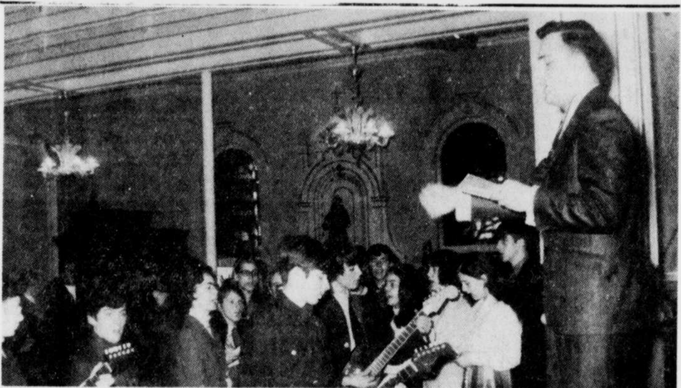
MESSE CONTEMPORAINE — Un grand nombre de jeunes ainsi que des adultes prennent part à la messe contemporaine du dimanche, initiative inaugurée il y a quelques semaines à Princeville. Les jeunes ont organisé un service d'accueil pour cette messe de "notre temps". Des jeunes s'occupent également des chants, des lectures et agissent comme servants. Des adultes secondent ces bonnes volontés par l'organisation générale. Des jeunes sont aussi à l'oeuvre pour la musique; comme on peut le constater par la photo ci-dessus, un orchestre remplace l'orgue pour cette messe contemporaine qui est chantée chaque dimanche à midi et quinze minutes à l'église paroissiale de Princeville.