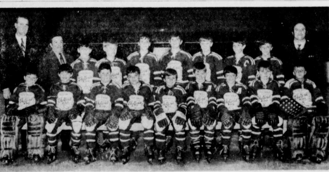
CHAMPIONS DES CANTONS DE L'EST. — Les Braves de Thetford Mines sont les nouveaux champions de la catégorie Mosquito des Cantons de l'Est. Les représentants ont affronté aujourd'hui et demain Duvernay dans une série de deux parties au total des points en quart-finale du championnat provincial.