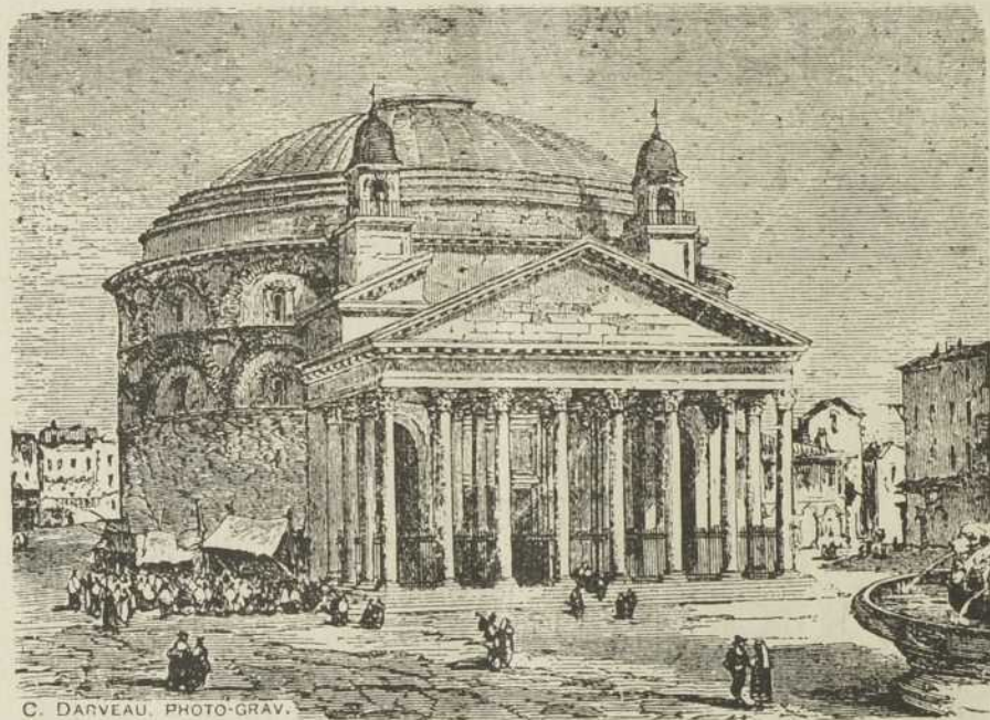
LE PANTHÉON D'AGRIPPA, A ROME

Les principaux chefs-d'œuvre de l'architecture romaine sont : le Panthéon d'Agrippa , le Colisée , l' Arc de Titus , la Colonne Trajane , etc. Tous ces monuments sont à Rome.