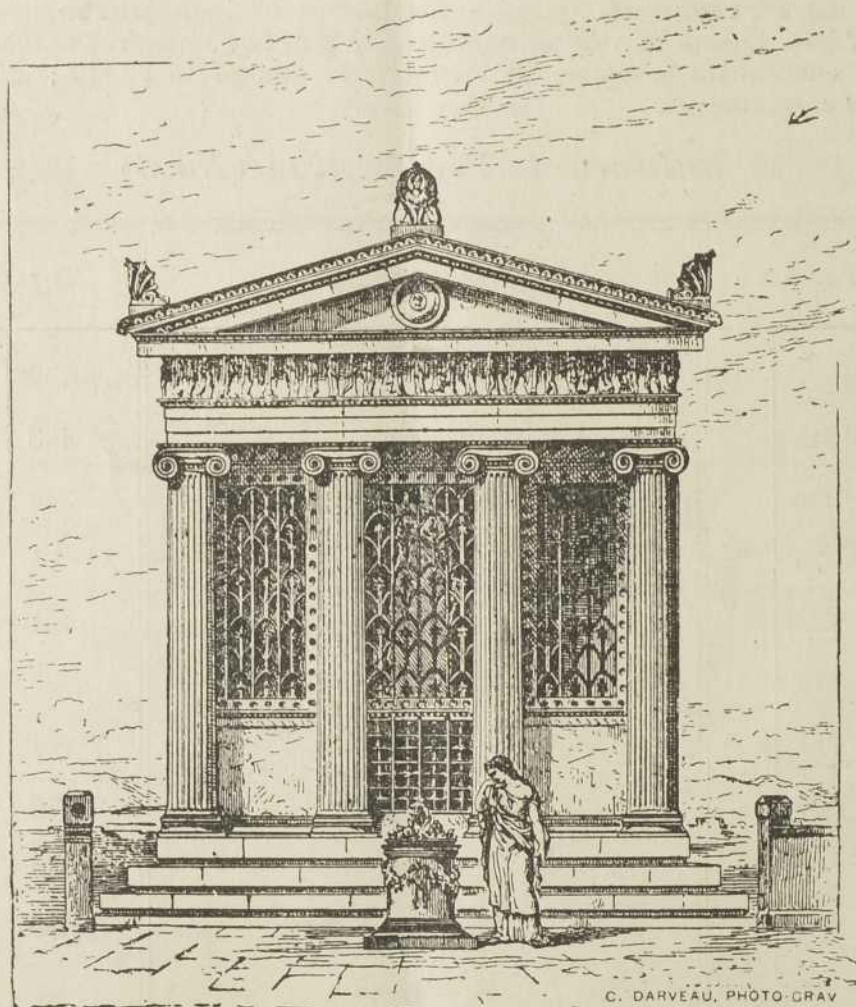
LE TEMPLE DE LA VICTOIRE

Le deuxième ordre de l'architecture grecque, nous l'avons vu précédemment, c'est l'ordre ionique . La colonne ionique—car ce sont les colonnes surtout qui distinguent les ordres d'architecture—diffère par le chapiteau (1) de la colonne dorique. Près de son sommet, les cannelures s'arrêtent et la colonne s'élargit pour former deux enroulements, assez semblables à la spirale d'une coquille d'escargot. C'est sur ces deux volutes que repose la toiture du monument.