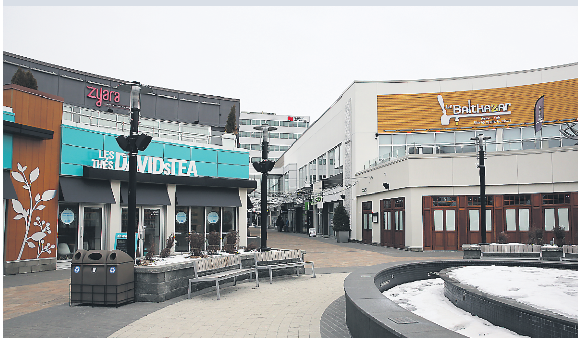
Des clients ont dit avoir eu de la difficulté à trouver les boutiques au Square, et même à trouver le Square. Des locataires et ex-locataires nous ont également dit avoir reçu régulièrement des appels de consommateurs qui étaient au DIX30 et qui ne trouvaient pas leur commerce.