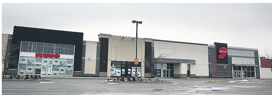
Dans le secteur des grandes surfaces, en bordure de l'autoroute 30, les trois locaux entre DeSerres et Déco Découverte sont libres. Celui qu'occupait Bovet également.